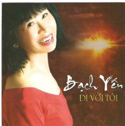
Bach Yen 2007