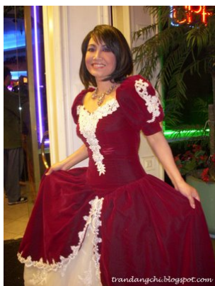
Nữ Danh ca THANH LAN