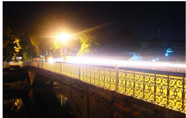
và cây Cầu Ga bây giờ