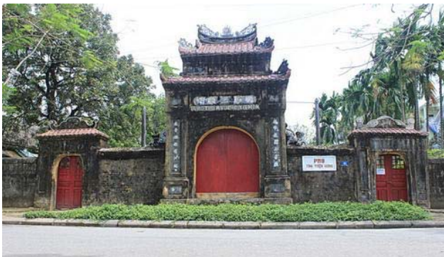
Phủ Tùng Thiện Vương Miên Thẩm

Tùng Thiện Vương Miên Thẩm, con trai thứ mười của vua Minh Mạng. Sinh thời, ông nổi tiếng với tài văn thơ xuất chúng, vua Tự Đức từng khen ông và người em cùng cha khác mẹ với ông là Tuy Lý Vương Miên Trinh: “Thi đáo Tùng, Tuy bất Thịnh Đường”. Có nghĩa là thơ văn giỏi như Tùng Thiện Vương, Tuy Lý Vương thì thơ thời Thịnh Đường không còn nghĩa lý gì cả.