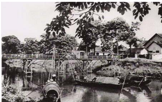
Cầu An Cựu xưa kia

Kể từ Tây lại, sứ sang Đò Trường Tiền khác bến, chợ Đường Ngang đổi dời Ơi em ơi, em ăn ở làm cho có đất có trời Đừng ham duyên mới phụ lời nước non.