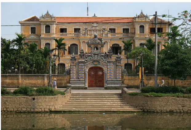
An Định Cung

Ở địa chỉ 179 Phan Đình Phùng là vương phủ của Kiên Thái Vương Hồng Cai (1845-1876), con trai thứ 26 của Hoàng Đế Thiệu Trị. Kiên Thái Vương là thân phụ của ba Hoàng Đế Kiến Phúc (1883-1884), Hàm Nghi (1884-1885), và Đồng Khánh (1885-1888). Việc này đã được dân Huế xưa kể bằng câu vè nổi tiếng: “Một nhà sinh đặng ba vua. Vua còn, vua mất, vua thua chạy dài”. (Vua Đồng Khánh – Kiến Phúc – Hàm Nghi).