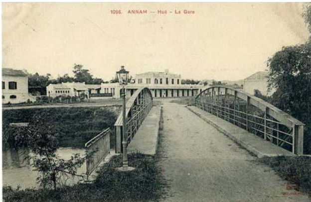
Cầu Ga ngày xưa, bên kia là Ga Huế