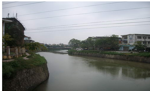
Nơi dòng sông uốn lượn

Từ cầu Nam Giao xuôi theo dòng khoảng vài trăm mét nữa sẽ đến cầu Bến Ngự. Cũng không hiểu sao trên dòng sông này các cây cầu lại san sát nhau đến vậy. Cầu Bến Ngự nằm trên đường Phan Bội Châu. Con đường này được hình thành từ đầu thế kỷ 19, cùng thời với việc xây dựng Đền Nam Giao. Đầu thế kỷ 20 có tên Nam Giao Cựu Lộ, người Pháp gọi là đường Song hành phía Đông (Rue Parallèle Est) (để phân biệt với đường Song hành phía Tây, tức đường Nam Giao Tân Lộ). Bến Ngự là một địa danh hết sức quen thuộc. Bến Ngự, tức là bến sông nơi vua chúa hay đáp thuyền qua lại. Sở dĩ có tên gọi này, vì vào năm 1738, chúa Nguyễn Phúc Khoát cho dời dinh từ Bác Vọng về Phú Xuân và cho đắp đê Nam Giao trên đất ấp Trường An, ở bờ Nam sông An Cựu. Hàng năm đều tế vào tháng trọng xuân. Suốt trong thời gian này, vua chúa và các quan đại thần đều đi thuyền từ sông Hương, vào sông An Cựu rồi neo thuyền ở bờ Nam, theo con đường Nam Giao cựu lộ, tức đường Phan Bội Châu này nay để đến đền tế Nam Giao vì lúc đó chưa có con đường Nam Giao Tân lộ. Do vậy, nơi này mới có tên là Bến Ngự. Năm 1898, sau khi mở