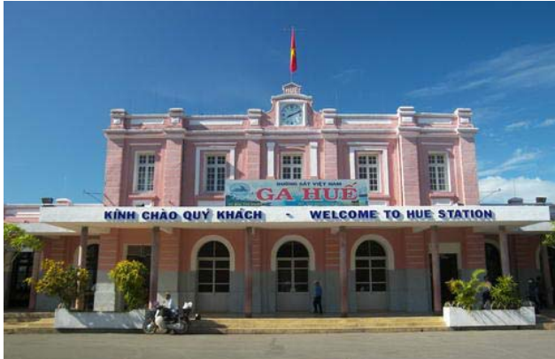
Ga Huế ngày nay

Cây cầu tiếp theo trên dòng sông này là cầu Nam Giao trên con đường Điện Biên Phủ. Con đường này chạy thẳng tắp đến tận Đền Nam Giao. Đường được hình thành vào năm 1898, nguyên trước nền rải bằng đất biên hòa. Lúc đầu đường có tên Nam Giao Tân Lộ (để phân biệt với Nam Giao Cựu lộ là đường Phan Bội Châu hiện nay), người Pháp thì gọi là Đại lộ Nam Giao (Avenue Nam Giao). Năm 1977 đường được đặt lại tên mới là đường Điện Biên Phủ, nhưng dân gian vẫn quen gọi là đường Nam Giao. Điều thú vị là con đường này rất thẳng, nếu bạn đứng tại điểm