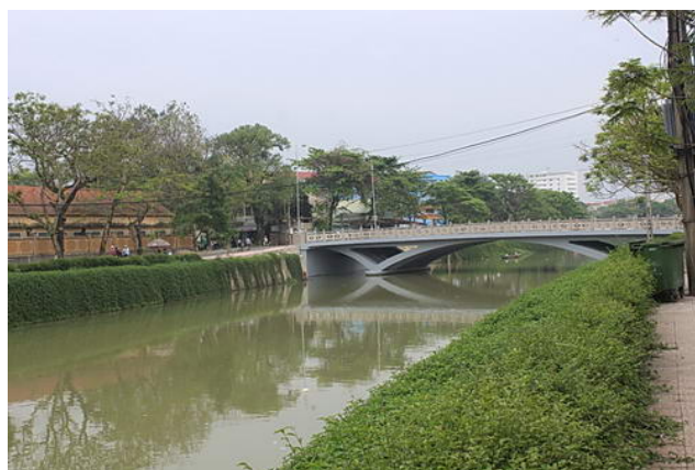
Cầu Phủ Cam vừa mới được xây dựng năm 2010