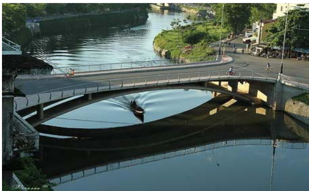
Cầu Nam Giao vừa mới xây dựng lại

cuối là Đền Nam Giao nhìn thẳng hướng con đường sẽ nhìn thấy cột cờ Thành Nội phía bên kia sông Hương. Xưa kia khi xây dựng Kinh thành Huế, các nhà phong thủy đã bố trí các công trình trên một trục thẳng hướng về phía nam với quan niệm: “Thánh nhân Nam diện nhi thính thiên hạ” (Kinh dịch – Thiên tử phải quay mặt về hướng Nam để cai trị thiên hạ), đó là Đền Nam Giao – Kỳ Đài – Ngọ Môn – Điện Thái Hòa. Và như vậy có thể nói rằng con đường này như là một trục thẳng hướng từ Đại Nội đến Đền Nam Giao. Một đồng nghiệp của tôi thuộc dòng dõi hoàng gia ngày xưa đã cho tôi biết thêm rằng thời kỳ ấy người ta đã dùng những ngọn đuốc vào ban đêm để nhả thành một đường thẳng như vậy.