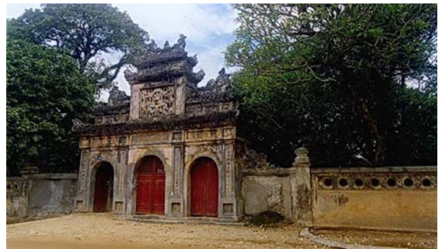
Phủ Kiên Thái Vương

Ở địa chỉ 179 Phan Đình Phùng là vương phủ của Kiên Thái Vương Hồng Cai (1845-1876), con trai thứ 26 của Hoàng Đế Thiệu Trị. Kiên Thái Vương là thân phụ của ba Hoàng Đế Kiến Phúc (1883-1884), Hàm Nghi (1884-1885), và Đồng Khánh (1885-1888). Việc này đã được dân Huế xưa kể bằng câu vè nổi tiếng: “Một nhà sinh đặng ba vua. Vua còn, vua mất, vua thua chạy dài”. (Vua Đồng Khánh – Kiến Phúc – Hàm Nghi).