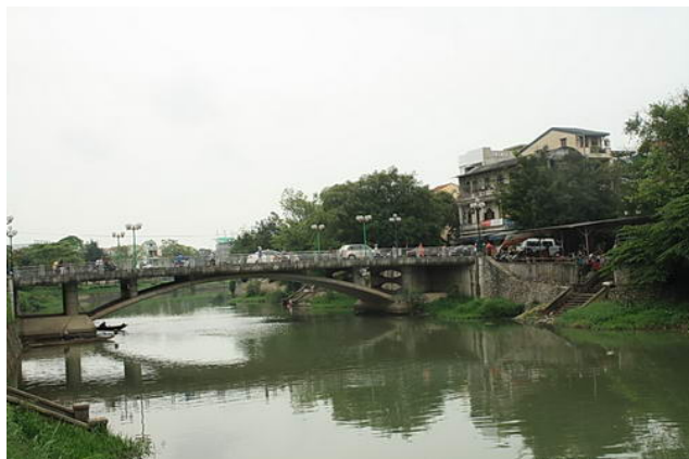
Cầu Bến Ngự

xong đường Nam Giao tân lộ, tức đường Điện Biên Phủ ngày nay, triều đình không dùng đường cũ để đến đàn Nam Giao nữa. Song địa danh Bến Ngự đã đi vào đời sống nhân dân.