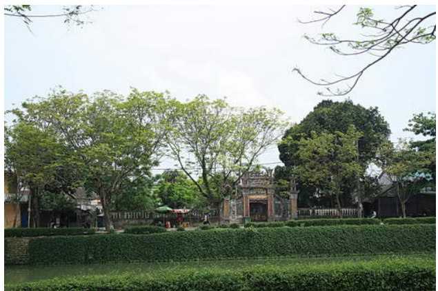
và cả đền thờ Đức Thánh Trần Hưng Đạo

Bên cạnh phủ Kiên Thái Vương là cung An Định. Cung được Hoàng Tử Phụng Hóa Bửu Đảo xây làm phủ riêng năm 1902. Năm 1916 Hoàng tử Bửu Đảo lên ngôi thành Hoàng đế Khải Định thì An Định trở thành cung riêng của Hoàng thái tử Vĩnh Thụy, tức Hoàng đế Bảo Đại sau này. Kế cận cung An Định, ở địa chỉ 181, là ngoại từ để thờ phượng tiên tổ của Khôn Nghi Hoàng Thái Hậu Tiên Cung (1868-1944). Tiếp sau