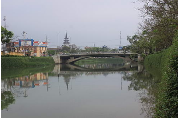
Cầu Kho Rèn

Bên kia cầu là con đường Nguyễn Trường Tộ với hai hàng cây long não xanh um. Vẫn còn đó ngôi nhà số 11/3, nơi cố nhạc sĩ Trịnh Công Sơn đã từng sống. Chính tại nơi đây, người nhạc sĩ tài hoa ấy hằng ngày vẫn nhìn bóng dáng của "một người con gái rất mong manh, đi qua những hàng cây long não lá li ti xanh mượt để đến trường đại học văn khoa ở Huế. Nhà cô ấy ở bên kia sông, mỗi ngày phải băng qua một cây cầu rồi mới gặp hàng long não để đến trường" và ca khúc "Diễm Xưa" đã ra đời tại đây, ghi một dấu mốc cho ca từ đầy chất huyền thoại của Sơn "...Ngày sau sỏi đá cũng cần có nhau".