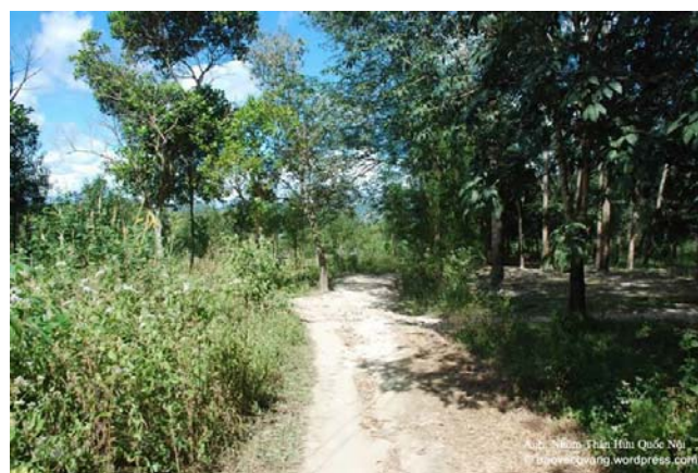
Ảnh: Nhóm Thân Hữu Quốc Nội © baovecovang.wordpress.com