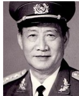
Hoàng Văn Thái