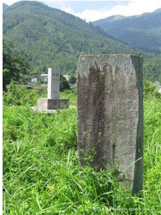
"Tân Kinh Báo" (Quảng Tây) đưa tin tức ngày 13.08.2010

Ảnh tham khảo: "Nhất xứ tam bài" (một nơi có 3 cột mốc) là hiện tượng sau các đợt đặt mốc quốc giới của hai bên Chính phủ CS Trung-Việt.