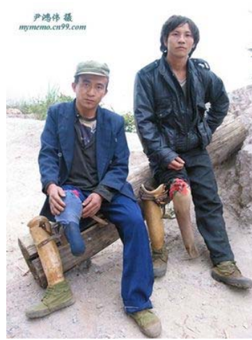
Các khu tử thần trên núi đồi Việt Nam (vùng Hà Giang) và vô số nhân dân nay đang được chính phủ Trung Quốc bảo hộ.

Lý Văn Vật Hu "Trung Việt Lục Địa Biên Giới Điều Ước" đặt ra 1537 tọa cột mốc biên giới cần thiết lập trên 1347 Km tuyến biên giới Trung-Việt. Vào tháng 9 năm 2002, Cục Đo Đạc Quốc Gia Trung Quốc phái 39 nhân viên kỹ thuật thường trú đến 12 tọa điểm biên giới kết hợp với công binh chính quyền Vân Nam, Quảng Tây và chính phủ CS Việt Nam thực hiện công tác gỡ mìn. Tháng 11 năm 2005 sơ bộ hoàn thành, đến năm 2008 thì tuyên bố hoàn thành công tác gỡ mìn, phân giới, cắm mốc. Ngày 23.2.2009 đặt thành Lễ Hoàn Thành Phân Giới Cột Mốc Trung Việt (Chân Mây đã đưa tin qua bài "Đại Lễ Dâng Ải Nam Quan Cho Trung Cộng").