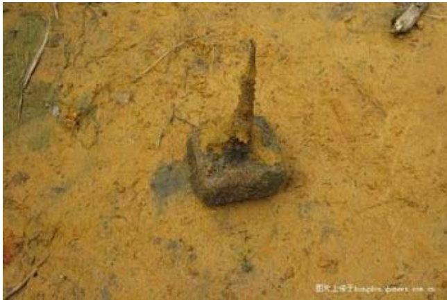
Khu vực Quảng Tây: Có cái bị đập vụn, có cái bị chôn dưới đất nhờ dân địa phương chỉ điểm để đào lên. Trơ trọi chiếc lõi cột mốc trăm năm!