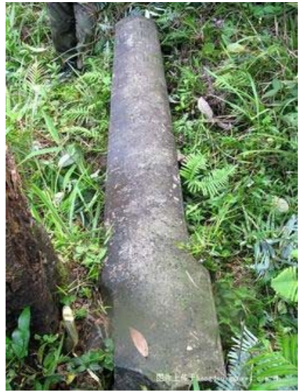
Tiêu mốc số 18 đoạn Quảng Tây-Việt Nam vẫn còn rõ hai mặt chữ "Đại Nam", "Đại Thanh" và năm tạo lập là 1893.