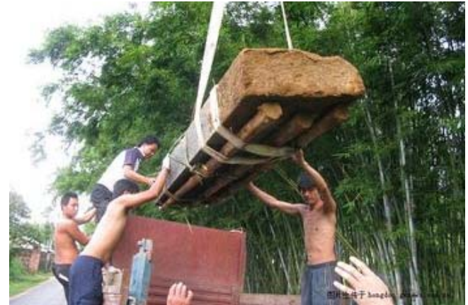
Việt Nam tham gia khuôn vác cột mốc quốc giới dâng cho Trung Cộng