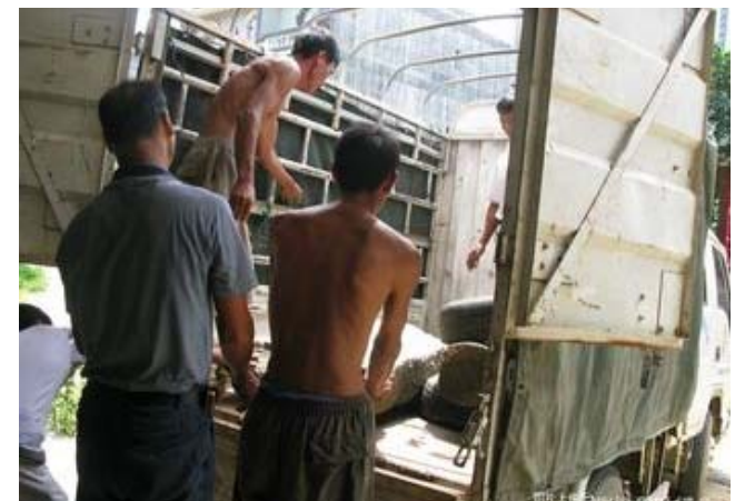
Đưa lên xe tải phi tang!