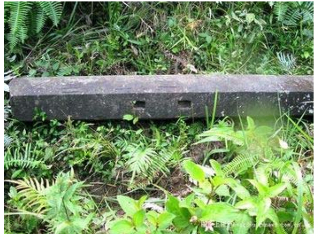
[IMG]Mốc giới mới (1050) và cũ "Trung Việt Quốc Giới, Khang Anh Ngoại Sách Số 5" trên đỉnh Bình Cương Lĩnh nay thuộc Quảng Tây. Có cả mốc cũ bị đập bỏ!