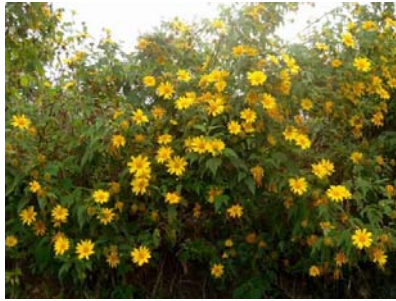
Uốn lượn bên sườn những con đường quanh co.