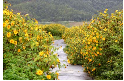
Khô lấp cả những con đường nhỏ