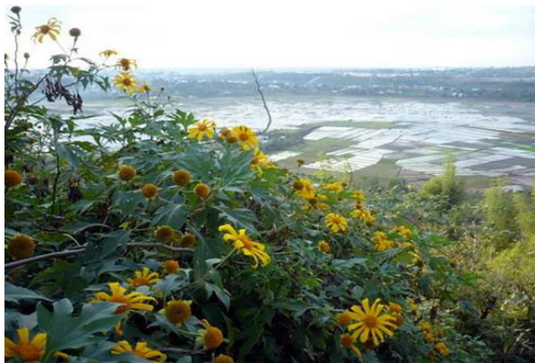
Tỏa sắc trên đồi cao