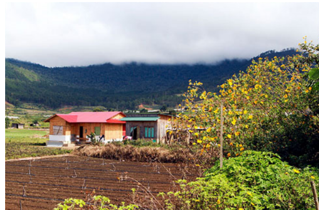
Bình yên bên những căn nhà gỗ nhỏ

Theo Wikipedia hoa Dã quỳ có nguồn gốc từ Trung Mỹ, tại Mexico, loài hoa này được gọi là Hương Dương Mexico. Còn ở Việt Nam, Dã quỳ được đưa vào trồng vào thời Pháp thuộc ở khắp các tỉnh miền Tây Nguyên với công dụng chủ yếu để làm phân xanh bón cho các vườn cao su, cafe. Ngoài ra, lá và hoa của Dã quỳ còn dùng để làm thuốc chữa một số bệnh ngoài da.