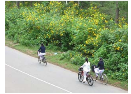
Tăng thêm vẻ đẹp của nữ sinh Đà Lạt