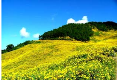
Bạt ngàn dưới đồi thông