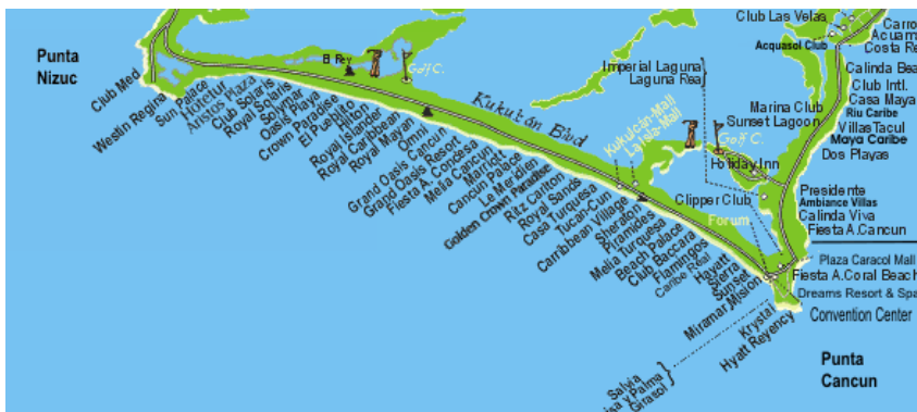
Bản đồ Cancun này bị cho nằm ngang, đáng lý phải dựng đứng mới phải

Vùng bãi biển chính dành cho du khách, kéo dài hàng mấy chục cây số nằm trên một dải đất san hô (Coral Reef) hẹp chỉ vừa đủ để xây những khách sạn đồ sộ nhìn ra biển, và một đại lộ tên Kukulcan chạy từ phía Nam từ mồm Punta Nizuc cho tới phía Bắc là mồm Punta Cancun. Gọi là hòn đảo nhưng nó không đứng cô lập giữa biển vì dải đất san hô này chỉ cách vùng đất