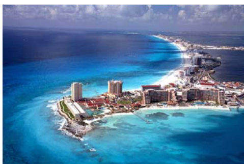
Hình chụp mồm phía Bắc của giải đất San Hô nơi có khách sạn Hyatt regency và Convention Center.

liền bởi một phá (lagoon) to lớn do nước biển tràn vào mang tên Nichupté Lagoon. Du khách có thể đi hết đại lộ Kukulcan này bằng xe buýt – giá vé là 9 pesos tương đương với 75 cents (1 dollar=12.8 pesos) - đến tận trung tâm thành phố Cancun gọi là El Centro, mất hơn nửa tiếng đồng hồ. El Centro ở phía Bắc phi trường Cancun cách xa khoảng 20 miles. Nếu du khách tạm trú ở một khách sạn nằm ở El Centro thì chỉ việc đi theo Ave. Tulum về phía Nam là đến phi trường.