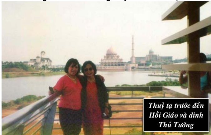
Thủy tạ trước đền Hội Giáo và dinh Thủ Tướng

ĂN TRƯA: Chúng tôi ăn trưa ở nhà hàng Rainbow Restaurant trong khu phố sạch sẽ có nhiều tiệm buôn quần áo tơ lụa, giày, ví.... Nhà hàng lớn, trang hoàng đẹp mắt nhưng món ăn không hợp khẩu vị của riêng tôi. Hầu như món nào cũng cay cay và có nước dứa. Cá chiên to trông ngon lành hấp dẫn nhưng nước sốt cũng cay. Rau xào quá nhiều tỏi. Tuy thế nước dứa, nước xoài rất ngon, nhất là