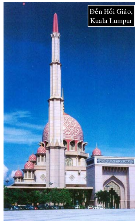
Dền Hồi Giáo, Kuala Lumpur