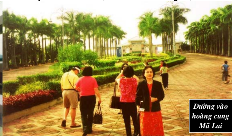
Đường vào hoàng cung Mã Lai

sau khi bị ăn cay, có ly nước trái cây mát lạnh, ngon không thể tả..