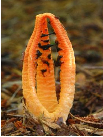
Nấm mực ống ( Pseudocolus fusiformis )