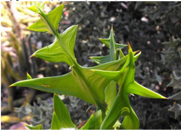
Cây gai chữ thập ( Colletia paradoxa )