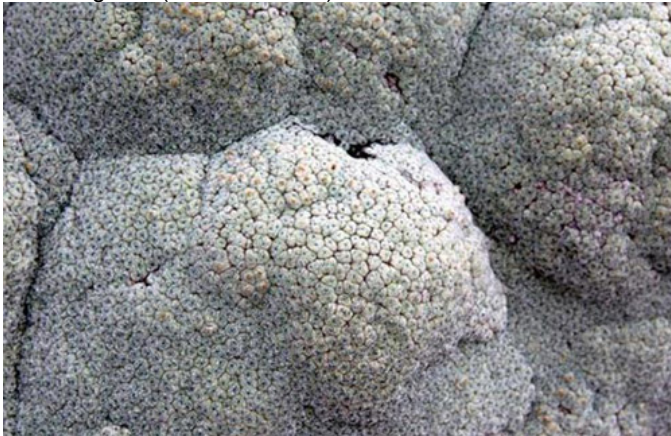
Rau lông cừu ( Raoulia eximia )