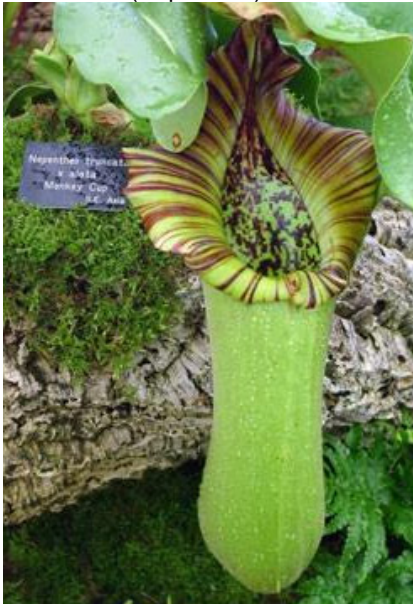
Hoa đài khí ( Nepenthes )