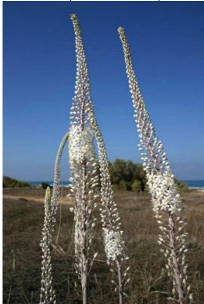
Hành biển ( Bowiea volubilis )