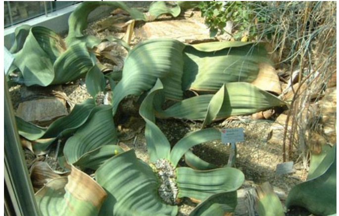
Cây tumbo ( Welwitschia mirabilis )