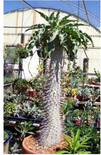
Cây vòi voi ( Pachypodium namaquanum )