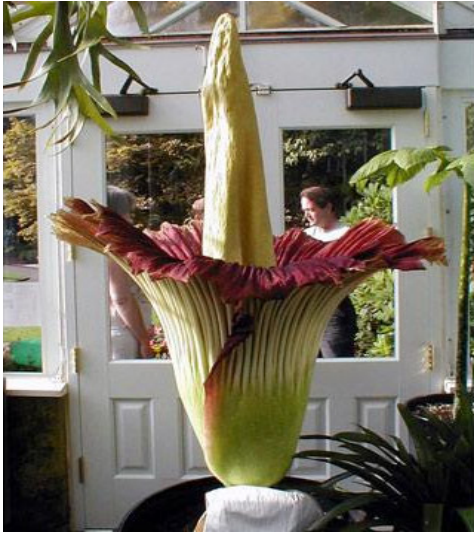
Hoa tử thi ( Amorphophallus titanum )