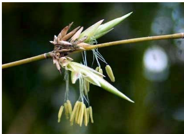
Cận cảnh hoa tre với những nhị vàng lung lảng