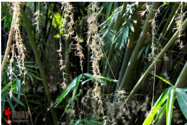
Dáng vẻ thướt tha như những cảnh liễu rủ.