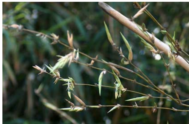
Chu kỳ nở lạ lùng của hoa tre kéo dài từ 60 đến 100 năm, bằng cả một đời người.