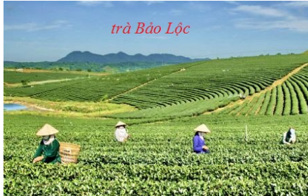
trà Bảo Lộc

Theo truyền thuyết hơn 6000 năm, vua Shin Nung (Thần Nông) tình cờ khám phá trà thơm ngon, có thể chữa bệnh. Huyền thoại về trà Bodhidharma (Bồ đề đạt ma) người Ấn Độ lúc ngồi thiền hay buồn ngủ, ngài giật cật mí mắt ném xuống đất và từ chỗ đó mọc lên cây trà. Chuyện hoang đường này cho rằng trà giúp sự thức tỉnh một sức mạnh của tâm linh.