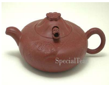
Bình trà chinese Yinxing đời Minh (1368-1644)

Các loại bình trà bằng sứ được làm qua nhiều thời kỳ khác nhau. Hơn 2000 năm trước Thiên Chúa, tại Trung Hoa có loại sứ Yih-Sing làm bằng đất sét vàng. Mãi cho đến triều đại nhà Tống/Song (960-1279) nghệ thuật thủ công nghệ làm những bình sứ màu trắng, chén, đĩa trà tinh xảo hơn.