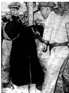
(Hình ông NDC sau khi bị xử Bắn)