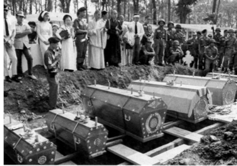
Ảnh "Vietnam, A Chronicle of the War", Black Dog & Leventhal Publishers, Inc. 2003, pg.478