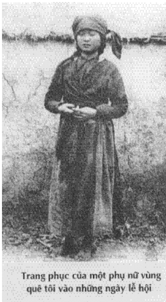
Trang phục của một phụ nữ vùng quê tôi vào những ngày lễ hội

“Một nong tằm là năm nong kén. Một nong kén là chín nén tơ.”