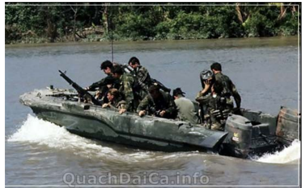
Biệt kích Mỹ thuộc Navy Seals trên sông Mekong năm 1967