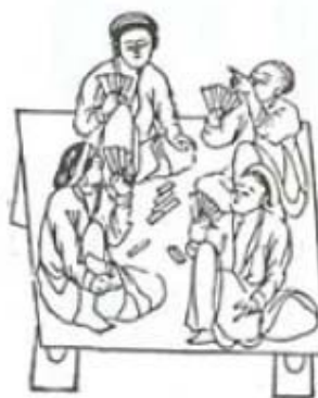
Chơi bài Tam Cúc