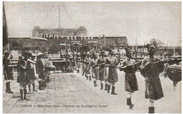
Quan quân tham dự lễ tế đầu xuân tại thành nội Huế