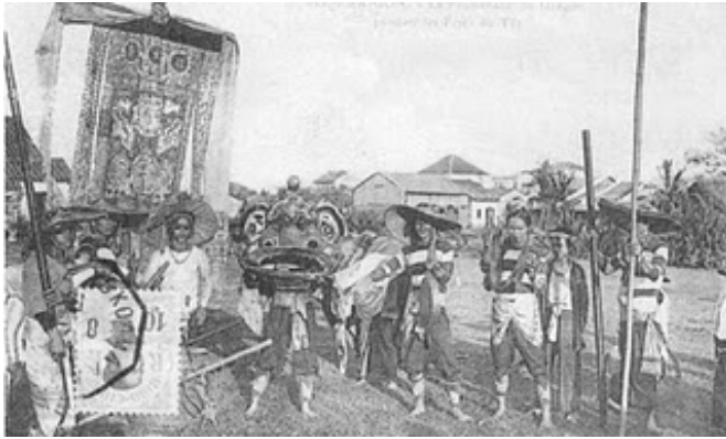
Đội múa rồng ngày Tết, Sài Gòn