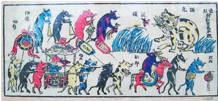
Đám cưới chuột Phụ bản Văn Nghệ Mới, Thái Tuấn thực hiện