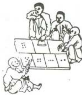
Chơi xúc xắc

Tết là ngày hội vui và thiêng liêng nhất vào mùa xuân trong năm, cả nước từ vua quan đến thứ dân đều tham gia các lễ hội. Xưa kia không có các tòa nhà, hội trường lớn rộng nên các lễ hội có nhiều người dự thường diễn ra tại các bãi đất, sân đình.