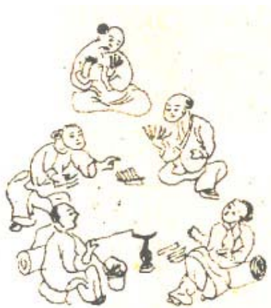
Đám xóc đĩa Chơi xúc xắc

Mồng một Tết ở nhà làm cỗ, mừng tuổi, chúc tết ông bà, cha mẹ; ngày mồng hai mang đồ biếu và chúc tết bên ngoài, thầy dạy học; ngày mồng ba thăm bà con, tảo mộ... Sau ba ngày Tết là vui chơi. Người khá giả, giới thượng lưu như các bà hạp nhau chơi bài tam cúc, các ông đánh chắn, tổ tôm. Bộ bài tổ tôm, chắn có 120 cây, người chơi thường có bốn chân, luật lệ tổ tôm chặt chẽ hơn chắn nên môn này chỉ dành cho các cụ khá giả. Bài tam cúc có thể từ hai đến bốn tay, chỉ có 32 quân làm bằng bìa mỏng, bề rộng dài cỡ hai ngón tay, một mặt cùng màu, mặt kia có vẽ hình, chia thành 16 quân đỏ và 16 quân đen. Các hình vẽ có tên tướng, sĩ, tượng, xe, pháo, mã, tốt như trong bộ cờ tướng. Bài tam cúc nay ít còn thấy. Chơi bài là thú giải trí tao nhã, hạp bạn thân thiết không phải để ăn thua.