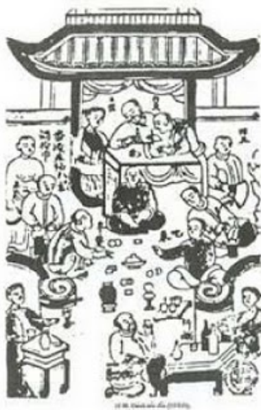
Đám xóc đĩa

cầu may, hên xui trong năm mới. Trò chơi xóc đĩa và xúc xắc đơn giản, dễ đánh hơn tài xỉu của Tàu và bầu cua tôm cá sau này.