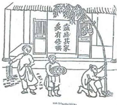
Đốt pháo – Trồng cây nêu

Cây nêu làm từ một cây tre để nguyên ngọn và cành lá. Cây nêu thường được cắm trước nhà, sâu dưới đất để gió không làm đổ. Trên cành nêu treo các khánh, mảnh kim loại hay lục lạc bằng đất nung... Khi gió thổi qua sẽ phát ra âm thanh. Trên ngọn cây nêu có máng chiếc mũ hay nón vải, áo dài hay dải vải, quanh gốc nêu thường rắc vôi trắng thành vòng tròn hay hình cánh cung. Cây nêu là dấu chỉ mảnh đất và căn nhà đã có người làm chủ, tà ma không được lai vãng. Dựng cây nêu ngày cuối năm âm lịch và hạ nêu vào mùng bảy Tết.