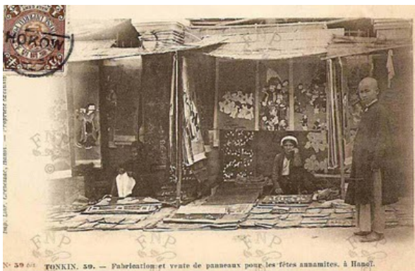
Hàng bán tranh Tết đầu đầu thế kỷ 20 tại Hà Nội Carte postale

ảnh mèo, chuột, ngựa, gà, cá kèm thêm kiệu, long, kèn... được nhân vật hóa thành đám cưới vừa hài hước vừa ý nghĩa: Bức tranh có hai hoạt cảnh, phần trên bốn chú chuột mang đồ lễ bác Mèo; phần dưới chú rể chuột cưới ngựa phía trước, cô dâu chuột ngồi kiệu theo sau, xung quanh các chú chuột cầm đèn, tán, lộng theo hầu... Mèo tượng trưng cho quyền sinh sát, chuột chỉ là phận nhỏ bé, tôi đòi, nhưng khôn lanh. Hạng thứ dân muốn sống còn, hạnh phúc phải biết cống lễ cho quan chức uy quyền. Triết lý sống mà ông cha chúng ta biết từ nhiều đời, đến nay thời đại toàn cầu hóa vẫn còn là bài học chua chát, châm biếm và hài hước ở quê nhà.