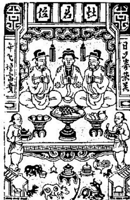
Táo Công ( 2 ông 1 bà )

(...) Bếp thì thờ Táo quân, gọi là Vua Bếp. Nó lấy chồng trước thì sa vào lửa mà chết, nó lại lấy chồng sau mà lòng còn thương nghĩa chồng trước, thì chồng sau đi xem nơi lỗ xưa, thì mình cũng sa xuống mà chết. Chồng sau thấy vợ chết, thì cũng gieo mình xuống mà chết, thì ba người vào