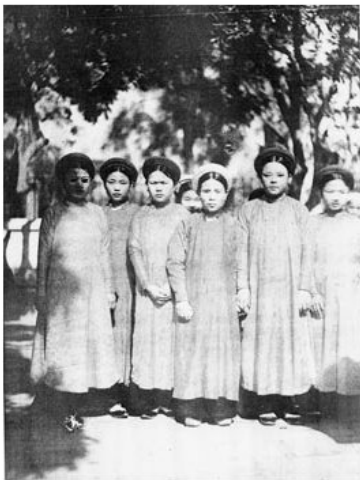
Quân cờ người

Quân nam mặc áo the hoặc áo tấc xanh, quần trắng ống sớ, thắt giầy lưng điều, chân đi giầy Gia-định.