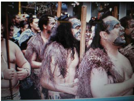
Người Maori

Theo Wikipedia người bản xứ Maori gốc Polynesian cư ngụ Tân Tây Lan vào thế kỷ thứ 10. Năm 1769 Đại úy James Cook của Hoàng gia Anh thám hiểm, tìm ra Tân Tây Lan, tuyên bố các đất đai đó thuộc Hoàng gia Anh, đưa người da trắng đến định cư nơi vùng đất mới thì nhiều nhưng dân cư thưa thớt. Người Maori đứng cảm chống lại những vũ khí thô sơ nên họ thua nhiều hơn thắng. Chiến tranh giữa hoàng gia và người Maori kéo dài cả thế kỷ, sau cùng hai bên ký thỏa hiệp. Maori nhận sự bảo hộ của Anh và Anh thừa nhận đất đai là của người Maori. Họ vẫn giữ phong tục, văn hóa cổ truyền của dân tộc. Hiện nay Tân tây lan có 74% người Âu châu, 15 % người Maori, còn lại là người Á châu và các dân tộc khác trên các đảo ở Thái bình dương.