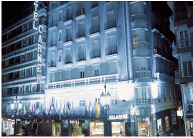
lâu đài Alhambra.

Du khách đến Granada là để thăm viếng toà lâu đài kiên cố Alhambra có lối kiến trúc của dân tộc Moor xây cất vào thế kỷ thứ 14 với nhiều khu vườn và hồ nước đẹp mắt – chúng tôi sẽ kể ở phần dưới đây – sau đó là đi xem Thánh Đường nơi chôn cất hoàng hậu Isabel và vua Ferdinand of Spain và sau hết là đi chơi khu vực Albaicin do dân Moor lập nên xưa kia, với những con phố hẹp ăn thông với nhau, hai bên là những nhà quét vôi trắng. Phía bắc thành phố Granada có ngọn đồi Sacromonte nổi tiếng là vùng có dân du mục sinh sống trong những hang đá.