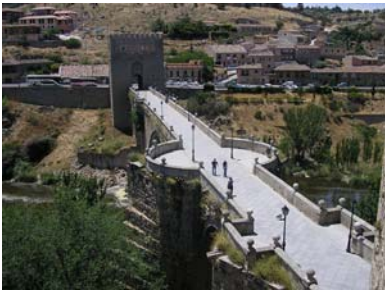
pháo đài Alcázar.

Toledo là một thành phố xây cất trên một triền núi, ba mặt được bao quanh bởi con sông Tagus (Rio Tajo) tạo nên một hàng rào phòng thủ thiên nhiên. Vì thế mà Toledo nổi tiếng về hai cây cầu kiên cố chạy về hai hướng Đông và Tây có từ thời La Mã. Toledo đã được Unesco công nhận là Di sản của Thế giới vào năm 1986 vì nơi đây có nhiều di tích lịch sử và văn hóa liên quan đến nhiều dân tộc Do Thái, Công Giáo, và Moor (Ả Rập). Nhiều văn nghệ sĩ nổi tiếng sinh ra hay sống tại nơi đây, như Al-Zarqali, Garcilaso de la Vega, Alfonso X và nhất là El Greco. Toledo nổi tiếng là nơi những chủng tộc khác nhau sinh sống hòa đồng cho đến khi họ bị đuổi đi như dân Do Thái vào năm 1492 và dân Hồi Giáo năm 1502. Toledo còn là nơi họa sĩ nổi tiếng thế giới El Greco sống giai đoạn chót của cuộc đời ông, giai đoạn mà ông sáng tác những bức họa sang giá nhất trong đó có bức Lễ Chôn Cất Công Tước Orgaz hiện vẫn được trưng bày ở Nhà Thờ Santo Tomé. Toledo còn nổi tiếng vì có nhiều bãi biển tắm ở trường. Nhiều người thích đến nơi đây để được tự do ở chuồng chạy chơi, phá phách vào những ngày hội hè. Ngoài ra Toledo cũng nổi tiếng là nơi sản xuất kiếm và những dao đủ loại.