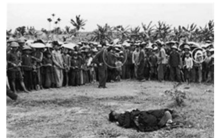
Cảnh đấu tố giết người của Hồ tặc 1953-1958