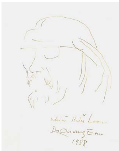
Nhìn Hữu Loan - Đỗ Quang Em 1988

Được biết trên giấy tờ ghi ngày sinh là 2/4.1916 nhưng theo tuổi thật thì ông sinh năm 1914. Ông mất ngày 18/3.2010, chỉ 14 ngày trước khi ông đầy 95 tuổi. Ông đã từng nói "95 tuổi mà mắt là đẹp lắm rồi". Vầng trán cao, sống mũi dọc dừa, đôi môi cân đối tạo cho ông một gương mặt điển trai. Ở tuổi gần 95 ông vẫn quắc thước với đôi mắt sáng. Nếu được bình chọn chắc hẳn ông phải được đưa vào danh sách nam nhân đẹp lão của thế kỷ này. Một người của thế giới văn bút như ông đã phải trải qua bao cơ cực nhọc nhằn của cuộc sống lao động vất vả cho người đời đổi diện một nụ cười ấm áp. Ông có nụ cười không chỉ nở trên môi mà còn nở sáng trong ánh mắt và thể hiện cả trên phong cách của ông. Điều này chứng tỏ dù trải qua nhiều khổ đau trong đời, lòng ông thực sự đã có tình yêu có hạnh phúc.