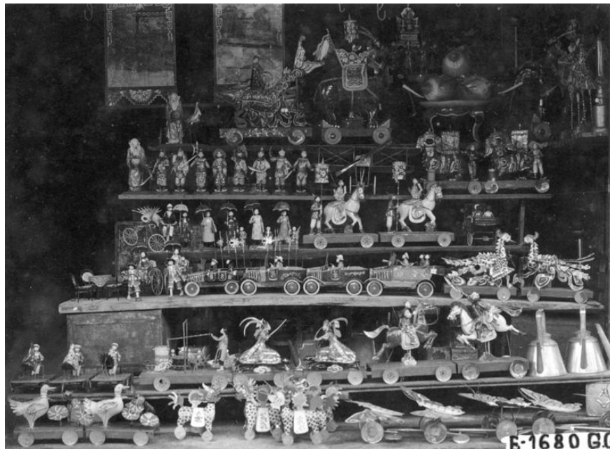
Sản phẩm và đồ chơi trẻ em