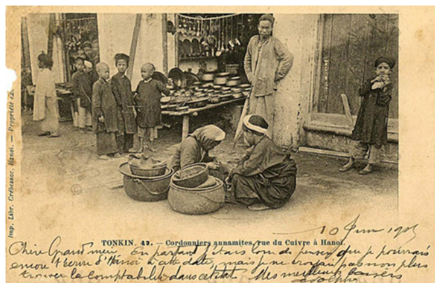
Cô hàng đồng nát.