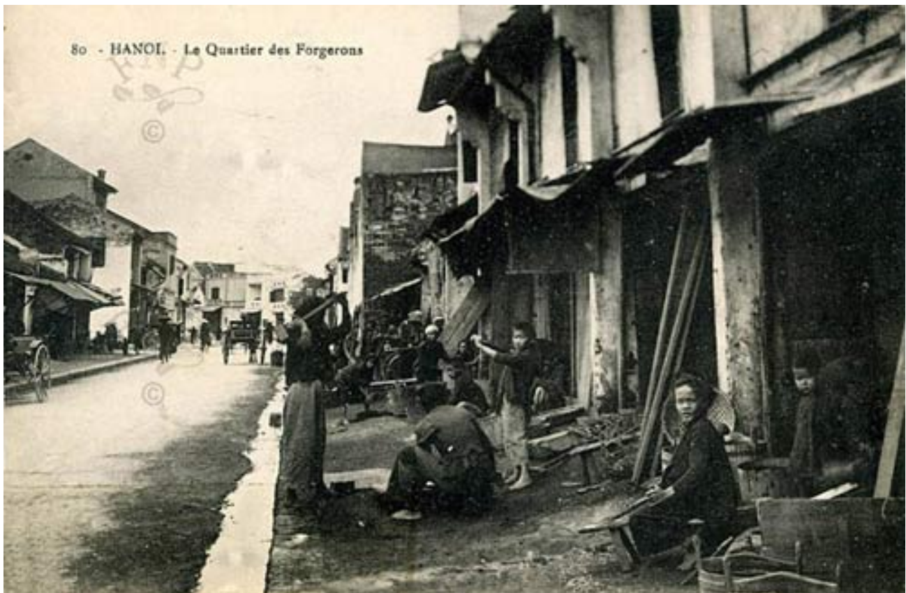
Phố Lò Rèn