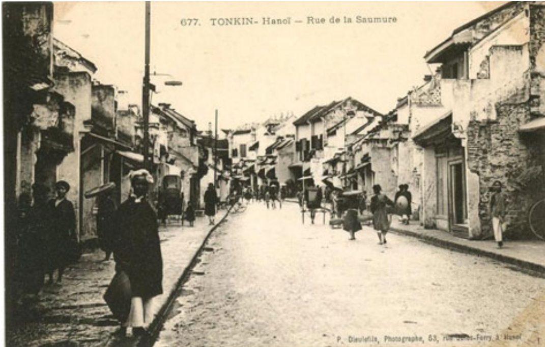
Phố Hàng Mắm (Rue de la Saumure).

Năm 1884, bác sĩ Hocquard mô tả: "Cửa hàng bán mắm, vệt ướp, cá khô treo trên trần nhà. Mùi nước mắm, mắm tôm nồng nặc"; thì 50 năm sau, năm 1934 Bonifaci mô tả: "Phố Hàng Mắm bốc mùi khó chịu, trong nhà bán tôm cá khô."