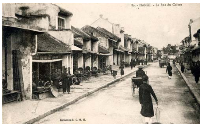
Phố hàng đồng

Vật dụng bằng đồng như đỉnh hay chân nến cùng các đồ tế tự bằng đồng, chậu thau, ống nhỏ và nhất là nồi đồng, chảo đồng và mâm đồng là những đồ gia dụng của những gia đình khá giả. Các cửa hàng ở phố chỉ bày bán sản phẩm và thu mua đồ đồng cũ (vì thế có nghề “đồng nát”), còn việc chế tác tại các lò đồng ở nhiều vùng khác nhau. Hình ảnh cô hàng “đồng nát” đang cùng chủ hiệu lựa các món đồ cũ ngay tại cửa hàng thật sinh động.