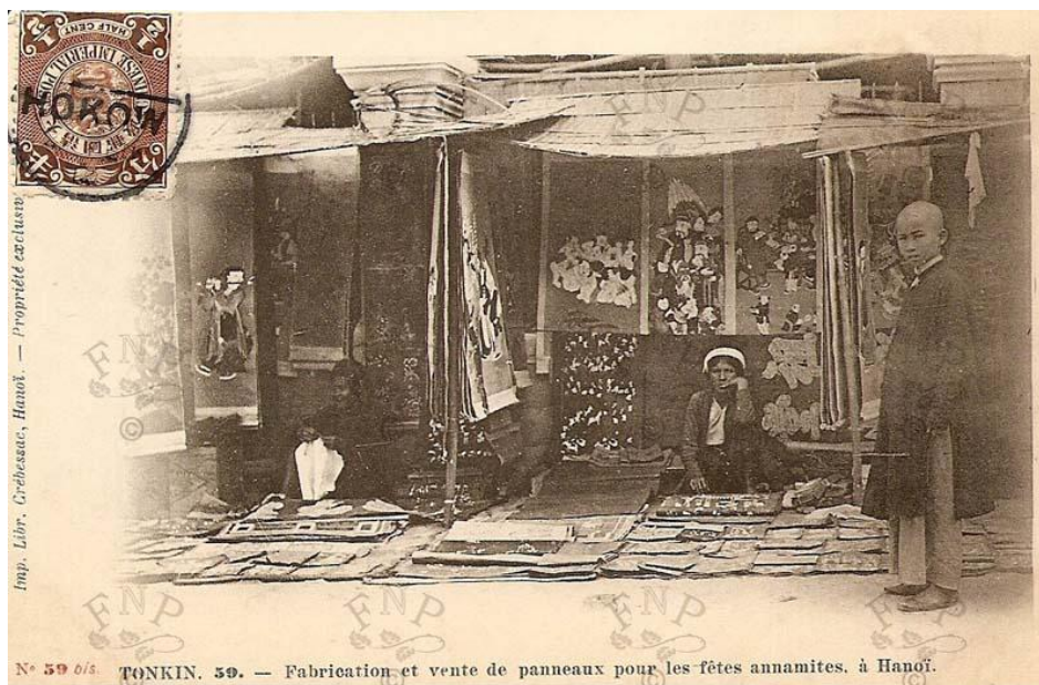
N o 59 ois. TONKIN. 59. — Fabrication et vente de panneaux pour les fêtes annamites, à Hanoï.