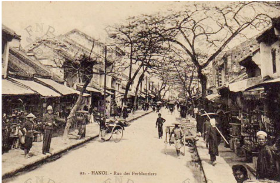
Đường phố Hàng Thiếc xưa.