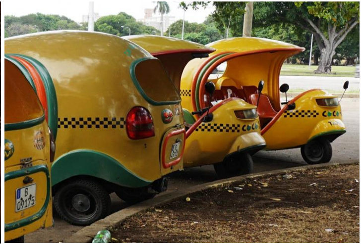
Họ vất hộp không (hộp cigars) đầy ngoài đường, cạnh tiệm bán cigars và rượu. Một loại xe Taxi đặc biệt ở Cuba