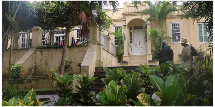
Nhà của văn sĩ ở có khác, có một giàn hoa tím thật là thơ mộng