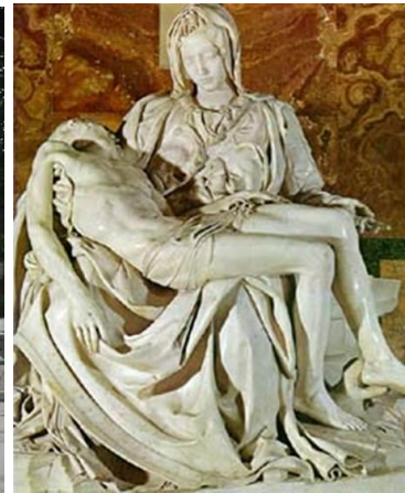
The Pieta: pho tượng nổi tiếng đức mẹ Maria ôm Chúa Jesus đang hấp hối cũng được bắt chước tạo dựng ở đây. The Pieta by Michelangelo

The Pieta là pho tượng duy nhất mà Michelangelo ký tên ông. Michelangelo nổi tiếng tức khắc sau khi ông cho ra đời bức tượng này. Hiện The Pieta đang nằm trong nhà thờ St. Peter's Basilica, Vatican City. Vài năm sau đó, wellknown (có nhiều người biết đến), thiên tài Michelangelo tạo được thêm một bức tượng rất nổi tiếng khác có tên là David. Phải mất đến hơn 2 năm, Michelangelo mới hoàn tất xong David, khi đó ông còn trẻ lắm, mới có 26 tuổi. David nổi tiếng đến độ mỗi năm có hàng trăm nghìn người, hàng triệu người đến Ý để được nhìn thấy original David.