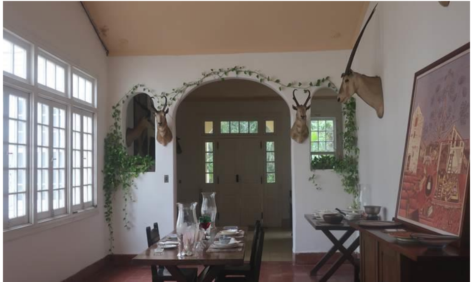
Căn gác mà Hemingway thường ngồi viết truyện. 1 căn phòng bên trong nhà của đại văn hào