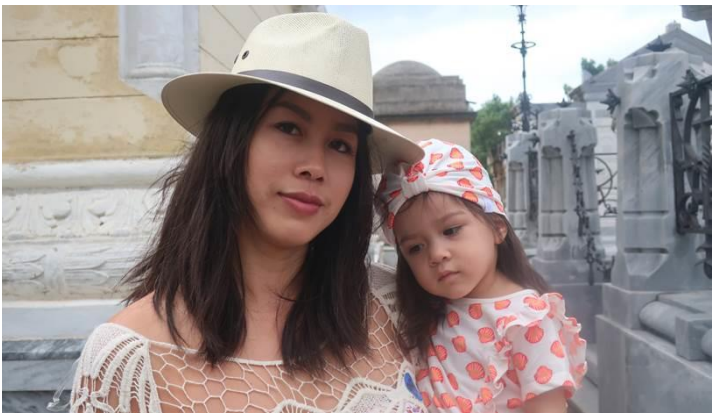
Con gái và cháu cưng của N

Ở Cuba và Haiti, họ bán nhiều áo móc bằng tay rất đẹp, rất rẻ, chỉ có khoảng $10 / 1 cái