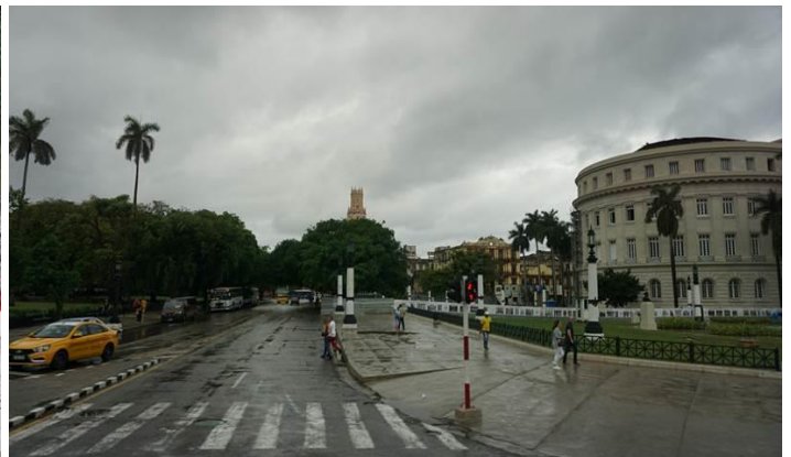
Chụp từ trong xe bus. Hai ảnh -đứng ngay cây dừa- này là công an?