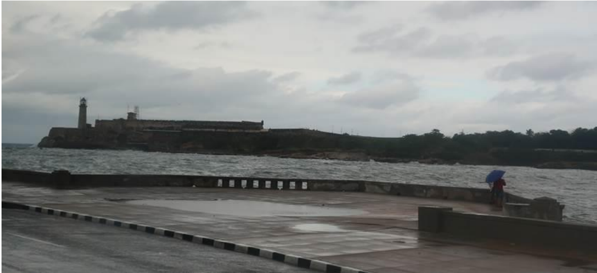
Có 2 người che chung 1 chiếc dù, cùng đứng nhìn ngắm biển. N từ xe bus nhìn xuống, thường thức được cảnh đẹp nên thơ này! Thấy họ tình tứ quá!