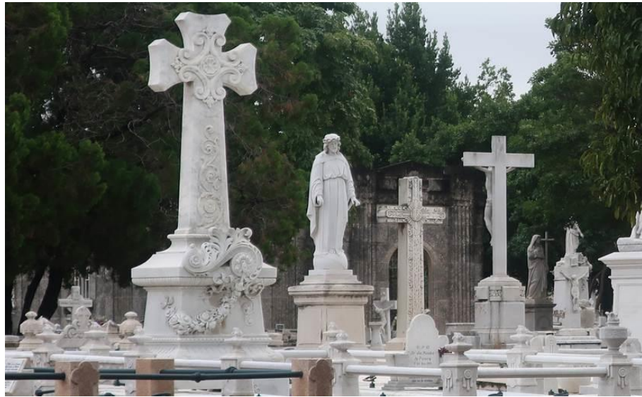
Ngôi mộ xây bằng đá marble