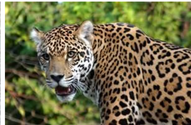
Jaguar (báo đốm Nam Mỹ) Hình N. lấy từ Internet

Ở Nam Mỹ thì có Jaguar, bộ lông của con Jaguar có hoa rất đẹp! Kỳ N đi Brazil tháng Năm năm 2015, may quá cũng có thấy được 1 con - nhưng không chụp được hình - ở gần khu thác nước Iquazu, biên giới giữa Brazil và Argentina.