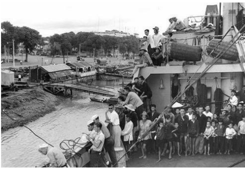
Hình chụp vào tháng 9 năm 1954 với một số người Bắc di cư trên tàu USS Bayfield khi tàu vừa cập bến Saigon. Sau Hiệp Định Geneve, tàu USS Bayfield là một trong những vận-chuyển hạm của Hải Quân Hoa Kỳ được giao phó nhiệm vụ chở người tị nạn từ Bắc vào Nam.