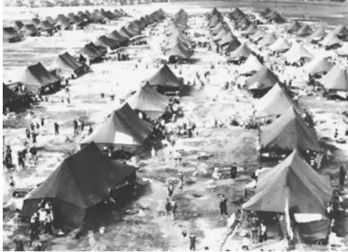
Hình chụp tại Saigon vào tháng 10 năm 1954 trong một trại định cư với hàng trăm căn lều. Lúc đó, một trong những trại định cư lớn nhất ở Saigon là trại Phú Thọ Lều được thiết lập tại Quận 10 sát bên trường đua Phú Thọ. Trại này có lúc đã chứa đến 10,000 người di cư.

1954 hầu hết cửa tiệm ăn do người Hoa kinh doanh, và họ dành độc quyền ngành lúa gạo cũng như các sạp thịt ở mọi chợ . Đời sống dễ dàng ở miền Nam khiến người Việt ít muốn cạnh tranh, ngay như ngành công chức cũng không hấp dẫn nhiều người. Bà con lao động xích lô kiếm đủ tiền tiêu trong ngày nhiều khi đẩy xe lên lè dưới bóng cây làm một giấc, khách gọi mướm cũng từ chối. Cách biệt giàu nghèo ở Nam Việt lúc ấy rất ít. Các tầng lớp dân di cư cần cù chịu đựng tham gia thi trường lao động đã làm cho đời sống kinh tế miền Nam lên cao nhưng lại buộc mọi người phải làm ăn chăm chỉ hơn . Một số người địa phương không hài lòng vì nếp sống thông thả lè phè cũ đã mất đi không còn trở lại.