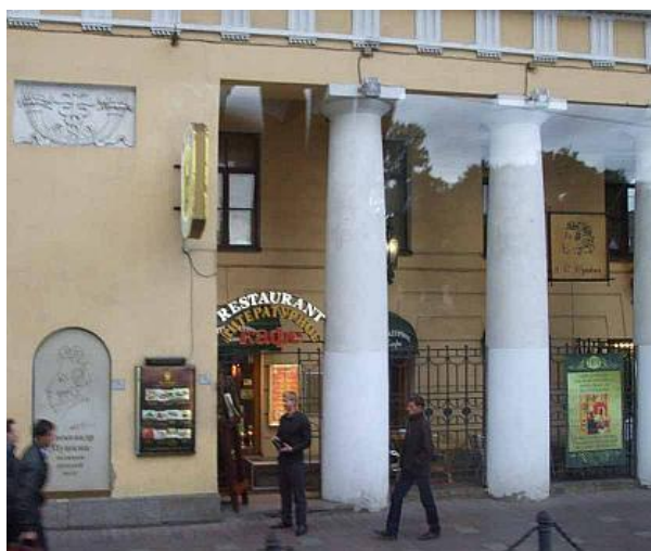
Quán Cà phê Văn Học (quán Pushkin)

Quảng trường Senate nằm ở tả ngạn sông Neva, ngay trước nhà thờ St Isaac, ngày trước được gọi là quảng trường Cuộc khởi nghĩa tháng 12 (Decembrists Square) để kỷ niệm cuộc cách mạng tháng 12 xảy ra ở đó vào năm 1825. Phía đông của quảng trường là tượng đài Kỳ mã bằng đồng (Bronze Horseman). Đây chính là tượng đài "Pierre Đại-Đế cưỡi ngựa" do Nữ hoàng Catherine The Great cho xây dựng để kỷ niệm Peter The Great. Có thể nói Nữ hoàng Catherine the Great đã thay đổi bộ mặt thành phố St. Petersburg và biến thành phố này thành một trong những đô thị được ca tụng nhiều nhất trên Âu châu.