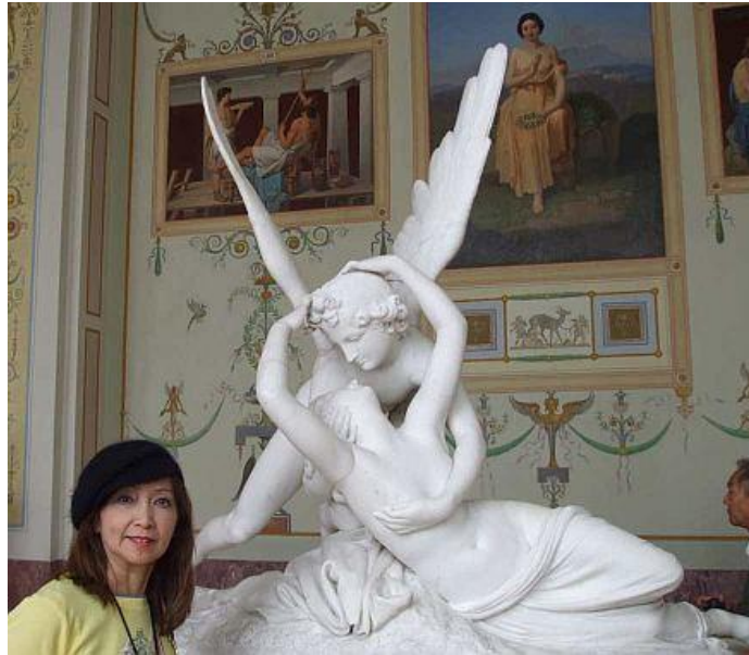
Rodin: Cupid & Psyche

Palace Square (Dvortsovaya Ploshchad), nằm ngay mặt sau của Cung điện mùa Đông (Hermitage Museum), là quảng trường đô thành của St Petersburg và của đế chế Nga thời trước. Nơi đây đã từng chứng kiến những biến cố đẫm máu như Ngày Chủ nhật đẫm máu (Bloody Sunday năm 1905) và Cách mạng tháng Mười 1917. Đứng giữa quảng trường là cột Alexander (1830-1834) do August de Montferrand thiết kế làm bằng đá đỏ cao 47.5 m.