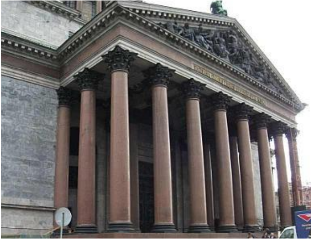
Đại thánh đường Isaac