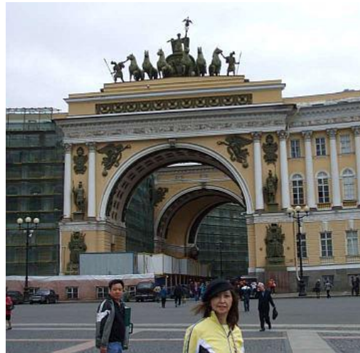
Triump Arch (Palace Square)