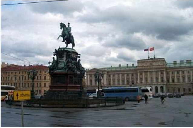
St Isaac Square: Nicolas Monument