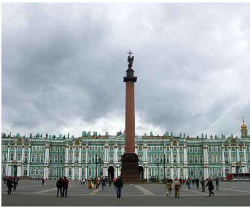
Quảng trường Palace

Buổi sáng: Thăm Quảng trường Palace của Cung điện mùa Đông. Thăm Viện bảo tàng Hermitage (được xếp hạng thứ nhì trên thế giới, chỉ sau Viện bảo tàng Louvre ở Pháp) Đây là nơi chứa một kho tàng đồ sộ về văn hóa và mỹ thuật của Nga và Châu Âu. Thời gian hạn hẹp không cho phép đi thăm được nhiều trong viện bảo tàng. Dù chỉ được nhìn lướt qua người viết cũng đã thấy chóng mặt về sự phong phú, đồ sộ và hào nhoáng của viện Hermitage này. Cung điện mùa Đông là một giải kiến trúc màu xanh nhạt và trắng, nhìn ra sông Néva. Mặt trong nhìn vào Quảng trường Palace.