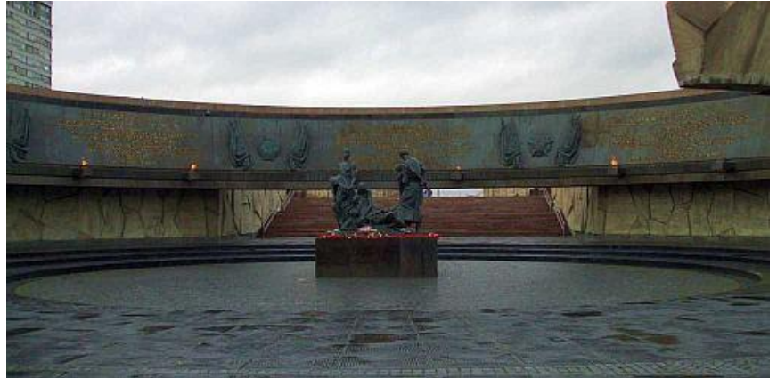
Đài kỷ niệm những anh hùng bảo vệ thành phố St Petersburg