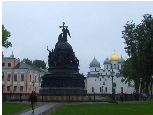
Saint Nicholas Church Đài kỷ niệm Thiên niên kỷ và Thánh đường St Sophia

Đài Thiên niên Kỷ hình chuông, bằng đồng, của Nga (Millennium of Russia) được xây dựng vào năm 1862 để kỷ niệm một ngàn năm hoàng đế Rurik đến Novgorod, một biến cố coi như điểm thành lập lịch sử nước Nga. Đài gồm hai tầng, tầng trên mang hình tượng những nhân vật quan trọng trong lịch sử Nga, tầng thứ hai là tượng khắc trạm những nhân vật nổi tiếng của Nga từ hoàng đế đến nhà văn, nhà thơ, nhà soạn nhạc, chính trị gia, v.v... Ngoài ra, tại nhà thờ Chúa Cứu thế Hiện linh /Cathedral of Christ Our Savior (Spaso Preobrazhenskii Sobor) trên đường Ilin có những bức icons nổi tiếng của nhà danh họa Theophanes the Greek (thế kỷ thứ 14).