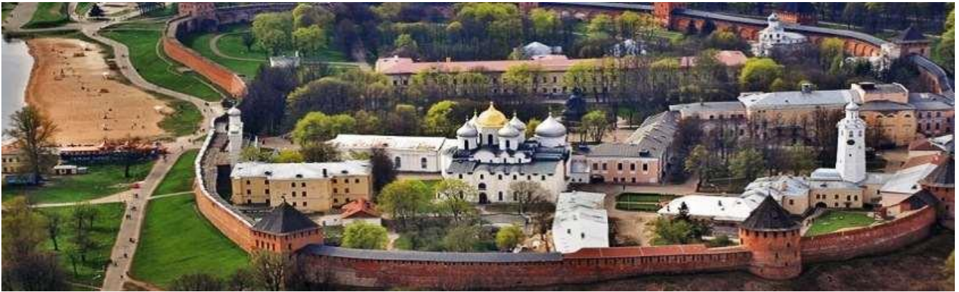
Toàn diện thành cổ Novgorod nhìn từ trên cao xuống

Buổi sáng: đoàn đi thăm Veliky Novgorod nằm trên công lộ liên bang M10 nối liền Moscow với St Petersburg. Veliky Novgorod, thường được gọi dân dị là Novgorod, nằm dọc theo sông Volkhov. Nơi đây có thành cổ Detinets của Novgorod, thành Kremlin xưa nhất trên đất Nga, chứa dinh thự cổ nhất của Nga, một chuông tháp (giữa thế kỷ 15), và một đồng hồ tháp cổ nhất (1673) cùng với nhà thờ Thánh Sophia, ngôi giáo đường đầu tiên xây bằng đá, và Chuông tượng đài bằng đồng "Thiên-niên-kỷ Nga".