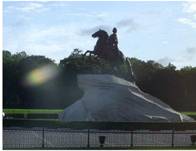
Senate square: The Bronze Horseman