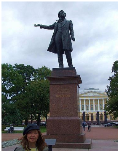
Pushkin (Art Square)