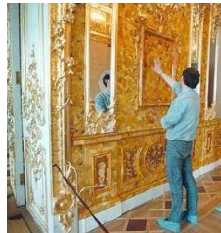
Phòng Hồ Phách

Cách đó không xa là dinh Alexandrovsky, căn nhà của vị Hoàng sa cuối cùng Nicholas II của Nga quốc. Gia đình Nicholas II đã rời nơi này vào năm 1917 để trốn sang Yekateringburg và rồi cả nhà bị dân cách mạng Bolsheviks thảm sát tàn bạo ở nơi đó.