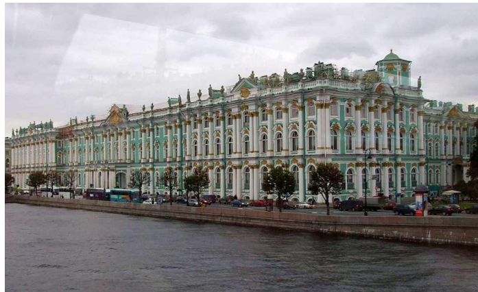
Cung điện mùa Đông nhìn ra sông Néva

Dinh thự mùa Đông hay Bảo tàng Viện Quốc gia Hermitage.