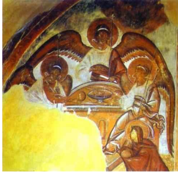
The Trinity. Fresco. 1378.

Buổi trưa: Rời Veliky Novgorod để đi St Petersburg (tên cũ là Leningrad), kinh đô của nước Nga Đế Chế năm xưa, do Peter The Great xây dựng bên cửa sông Néva.