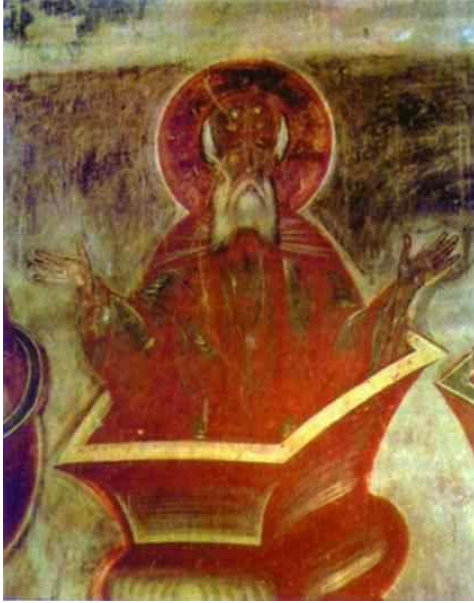
Fresco. 1378. The Church of Our Savior trên đường Ilyin, Novgorod, Russia