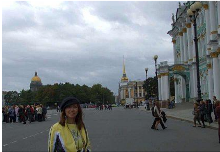
Nhà thờ Khram Spasana Krovi. Nhà thờ St Isaac, nhà thờ Peter và Paul (phía xa)