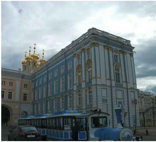
Trường học tại Thành phố Pushkin