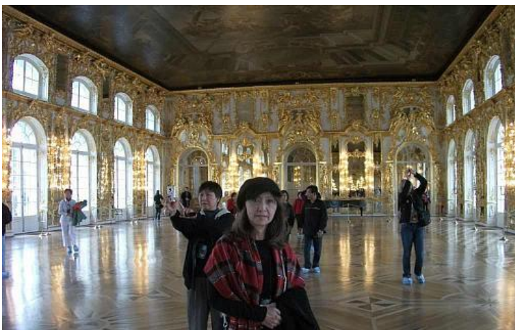
Catherine Palace: Đại sảnh đường