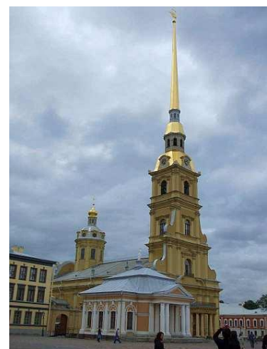
Pierre & Paul Cathedral