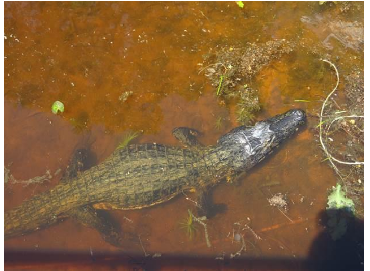
Trứng của caiman, caiman nhìn giống như cá sấu nhưng nhỏ hơn ---- Caiman