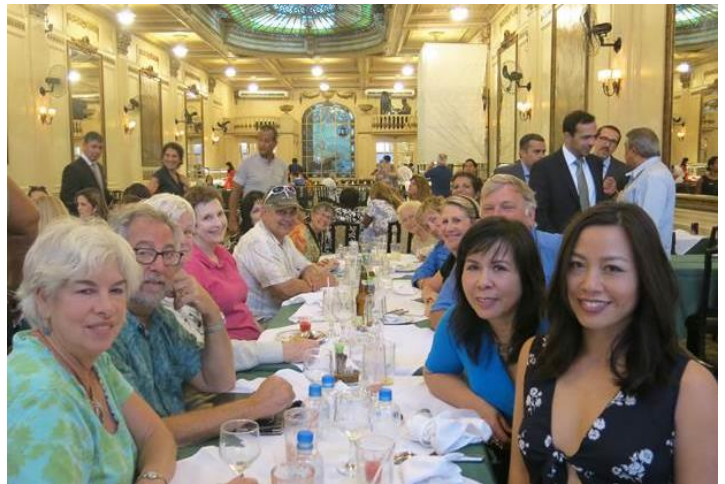
Ăn trưa tại nhà hàng nổi tiếng ở Rio: Nhà hàng rất lớn, lúc nào cũng đông khách. Từ trên lầu nhà hàng chụp xuống - nhóm của N ăn trên lầu hai