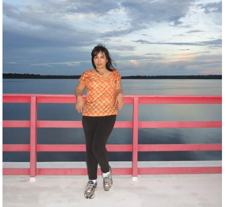
Lên tầng cao nhất trên tàu để đón hoàng hôn