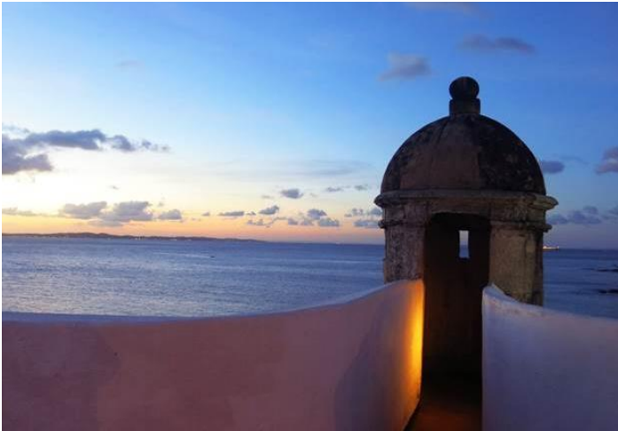
Hình chụp ở Salvador