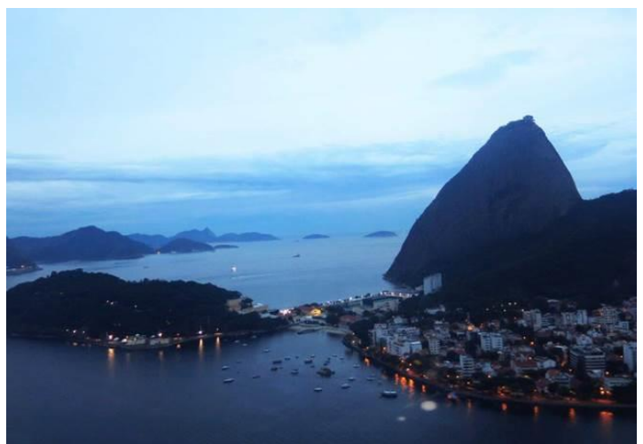
Hình chụp từ máy bay khi N. trở về Mỹ