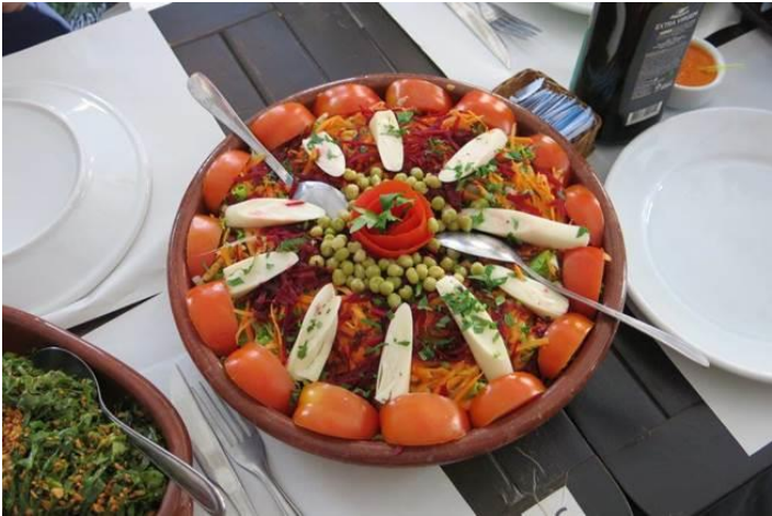
Xà lách bày thật đẹp