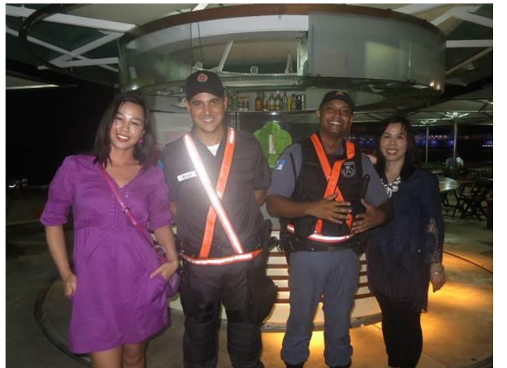
Chụp hình với 2 anh cảnh sát ở Rio