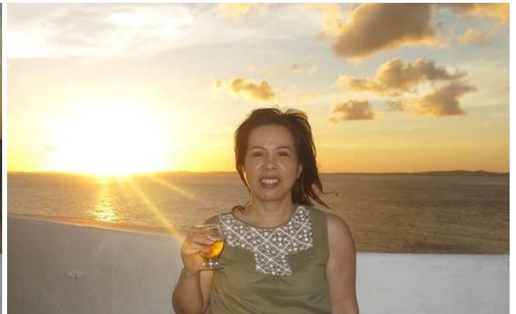
Mọi người uống rượu ngắm hoàng hôn