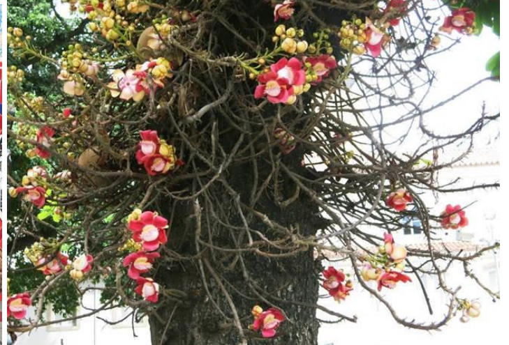
Hình cây Cannonball