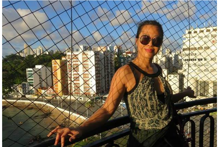
Sân của tòa nhà có ngọn hải đăng