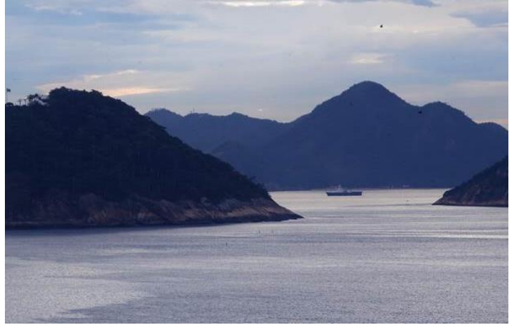
Cũng từ ban công, chụp qua hướng khác