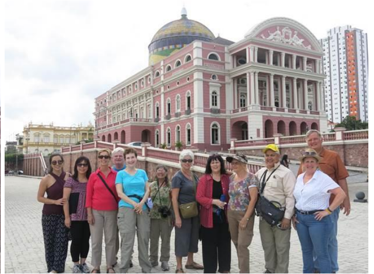
Nguyên cả nhóm