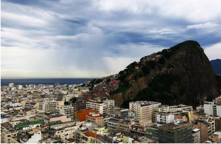
Từ ban công phòng ngủ chụp xuống