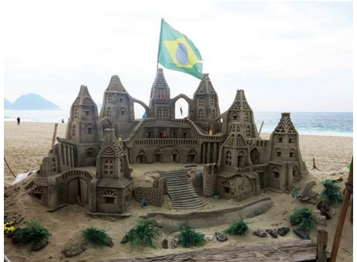
Sand sculptures / Copacabana Beach