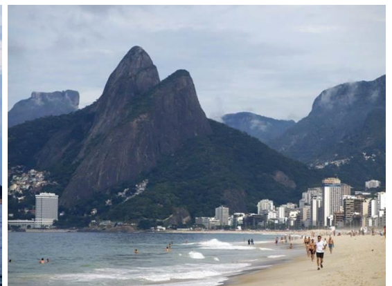
Một con bướm đến đậu trên tay của Phương An ----- Ipanema Beach