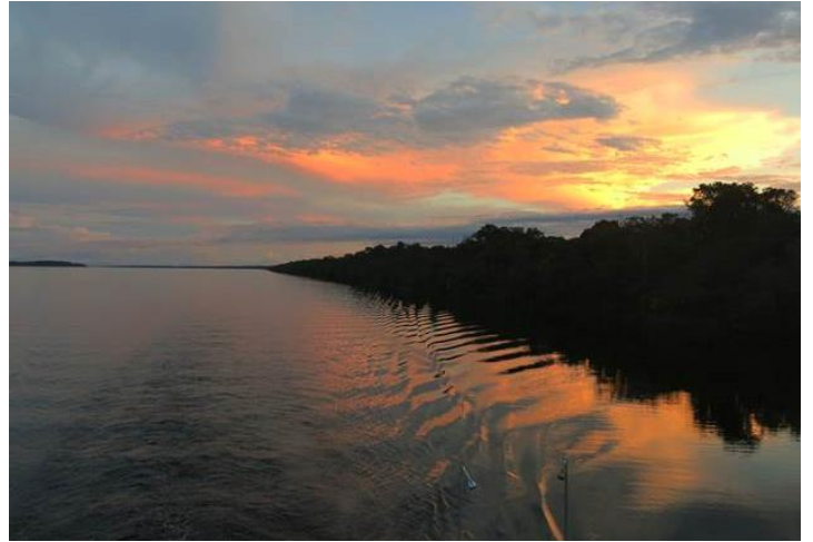
Hoàng hôn trên sông Amazon