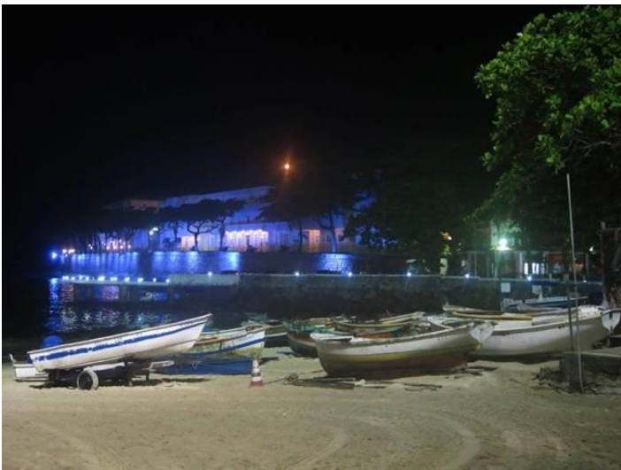
Hình dạo biển buổi tối / Copacabana Beach