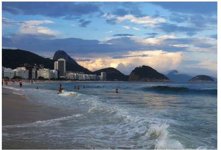
Hoàng hôn trên Copacabana Beach