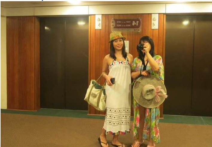
Đang đứng chờ elevator