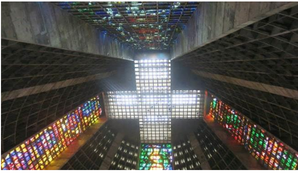
Từ dưới chụp lên trên trần, chỗ chòm nhà thờ được cắt ngang