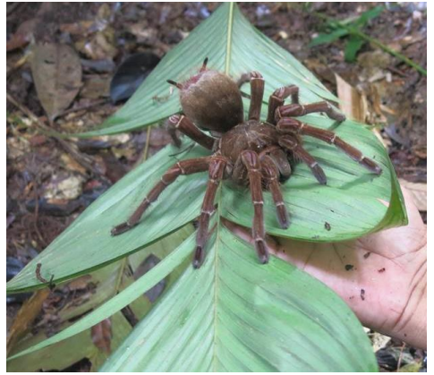
Một loại cóc bé tí xíu trong rừng già Amazon -- Một loại nhện to hơn cả bàn tay! Nhưng loại nhện này lại không có poison, cắn hông bị chết... Tuy thế, chỉ ông tour guide dám đụng đến nó, chứ hông có ai dám cả, sợ hãi! Hihi..