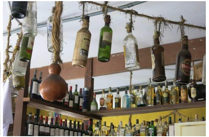
Hình nhà hàng trưng bày nhiều chai rượu