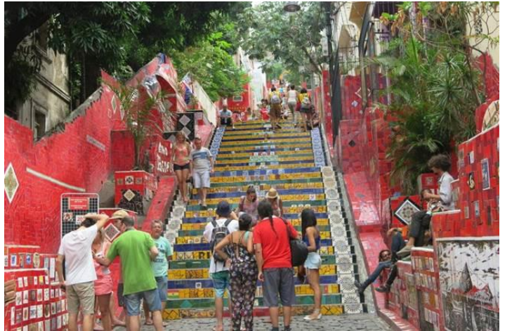
Selaron Steps rất nổi tiếng tại Rio