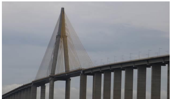
Irinduba Bridge over the Rio Negro, branch of the Amazon River, near Manaus