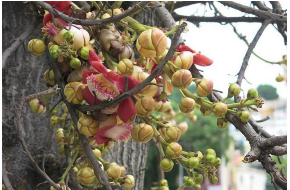
Cây và trái Cannonball