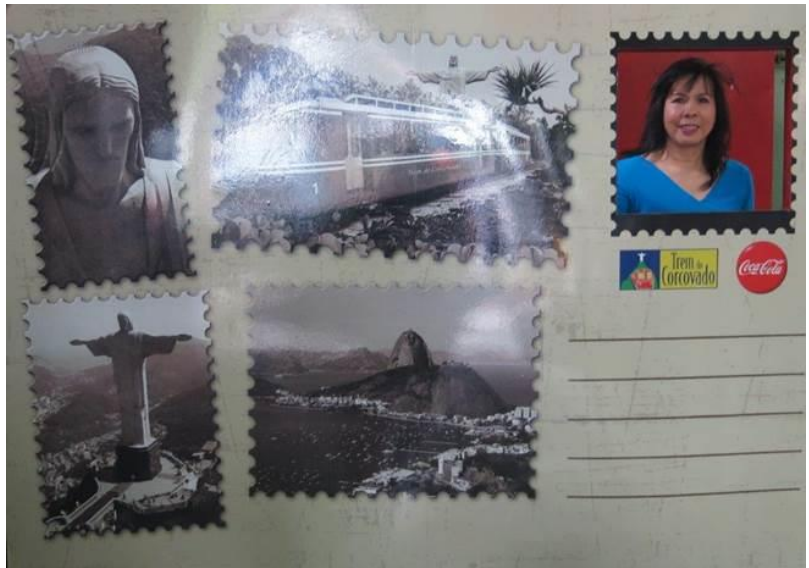
Hình Annie mang kính mát, cô nàng tự chụp lấy bằng cell phone đấy ạ. Con tem trên postcard là... N đó