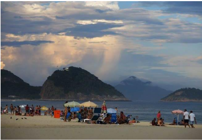
Bãi biển Copacabana