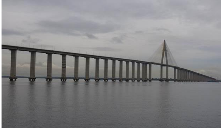
Đứng ở ban công ngắm trời ngắm biển, ngắm và chụp hình cây cầu khá vĩ đại