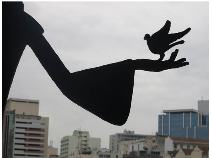
Cánh tay của một bức tượng thánh trong nhà thờ