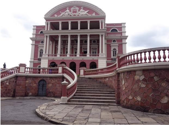
Tòa nhà Broadway nổi tiếng ở Manau