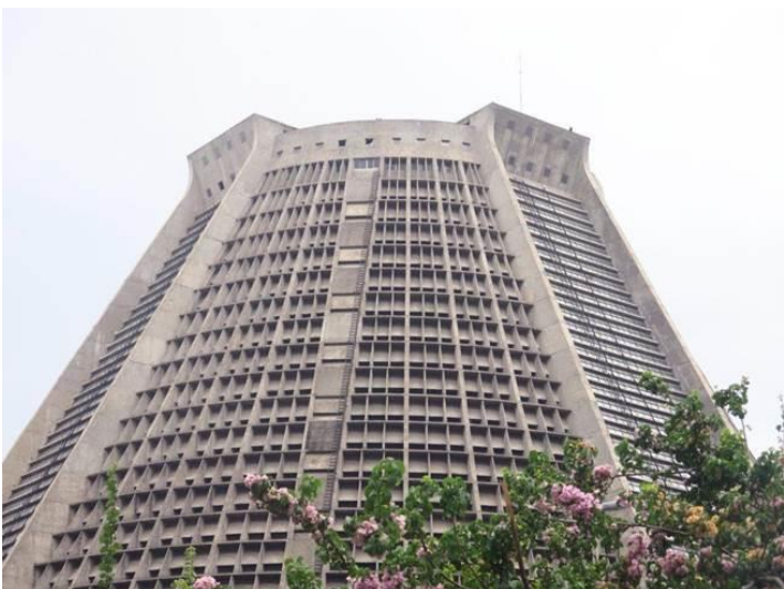
Nhà thờ Rio de Janeiro Cathedral