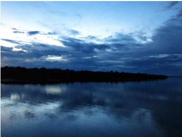
Cảnh đẹp lắm các bạn ơi!