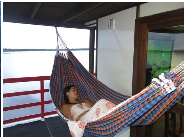
Đánh một giấc trước khi ăn cơm tối