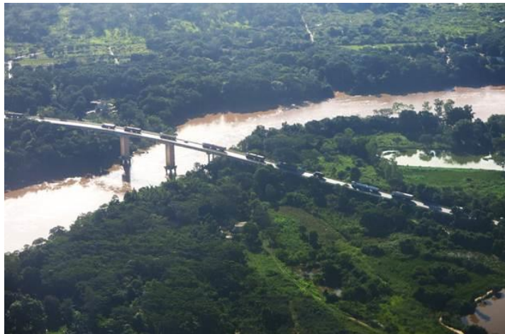
Dòng sông màu nâu đỏ. Trên máy bay chụp xuống