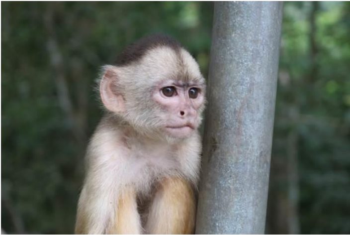
Một loại khỉ khác ở khu đầm sen