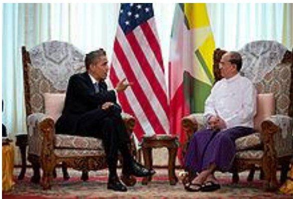
Thein Sein tiếp kiến TT Hoa Kỳ Barack Obama tại Yangon, 19 tháng 11 2012

Do sự độc tài của chính quyền quân đội, Miến Điện bị cấm vận nhiều năm, thành một trong những nước nghèo, kém phát triển. Hiện nay, Mỹ và Châu Âu đã mềm mỏng hơn. Mỹ sẽ từng bước dỡ bỏ cấm vận và cải thiện quan hệ nếu chính quyền Myanmar thể hiện những tiến bộ dân chủ .