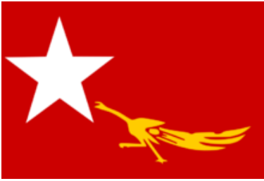
Lá cờ của Liên đoàn Quốc gia vì Dân chủ được thể hiện bởi một chú 'gà chọi', một biểu tượng của tự do