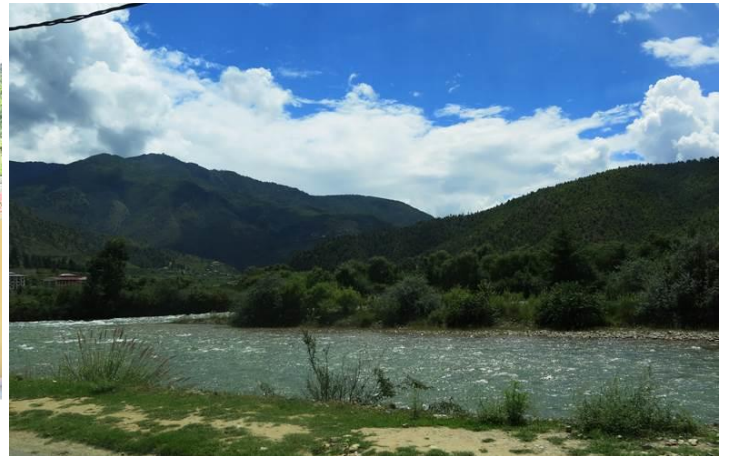
Mấy chú tiểu này dễ thương quá phải không ạ? Dòng sông hiền hòa uốn quanh nhìn thật là thơ mộng