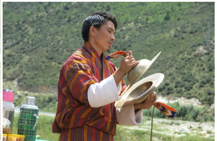
Anh chàng này mặc áo bằng da thú thật đó nha