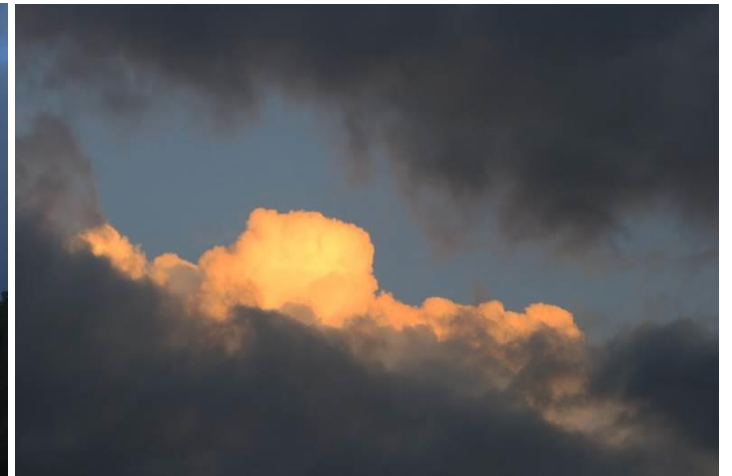
N rất mê ngắm trời mây nên các bạn sẽ còn thấy nhiều tấm hình N chụp về... mây, về bầu trời lúc bình minh hoặc mây và ánh tà dương khi chiều xuống