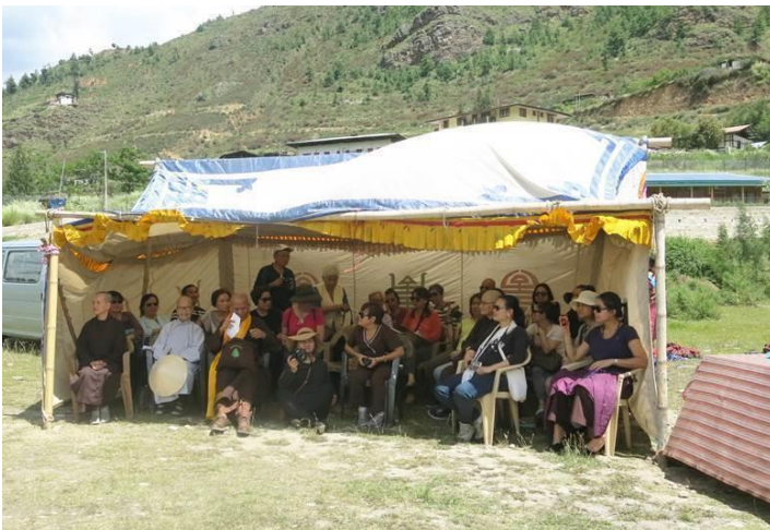
Lều che bằng tấm ny lông nên thảo nào nóng quá!

Không bị ô nhiễm không khí nên bầu trời ở Bhutan lúc nào cũng trong xanh tuyệt đẹp! Theo tin tức khí tượng nói 5 ngày ở Bhutan, ngày nào cũng có mưa nhưng may quá, hình như chả có ngày nào mưa cả.