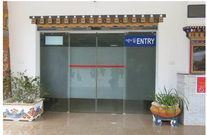
Sân bay quốc tế của Bhutan, nhỏ xíu à nhưng rất sạch, gọn và đẹp đẽ. Cũng có cửa mở tự động như ai chứ bộ