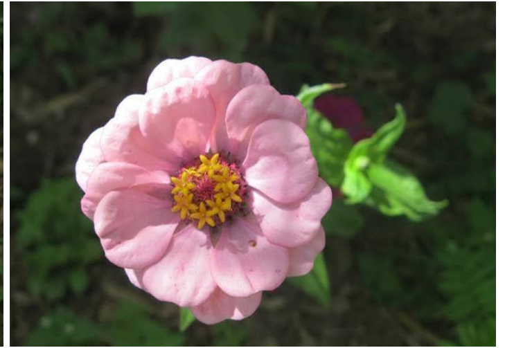
Một loại hoa mọc ở sân chùa N chưa từng thấy bao giờ. Nhụy hoa thật đẹp, có những bông hoa vàng nhỏ mọc trên nhụy. N thấy hoa có nhiều màu: cam, đỏ tươi, đỏ đậm, màu hồng nhạt, hồng đậm, hồng tươi (fuschia), màu vàng.