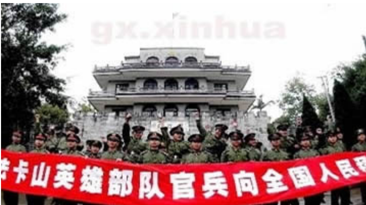
Cựu chiến binh trong chiến trận biên giới Trung-Việt hành hương. Thế hệ nào của Việt Nam sẽ được tường tận sự ô nhục này? Việc đòi hỏi Trung Cộng trả lại vùng đất thiêng của tổ quốc Việt Nam không phải dễ dàng! Sẽ lại đổ máu như hàng trăm năm trước!