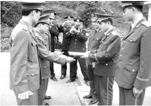
Hải quan hai bên Trung-Việt trao đổi công tác tại Km0 (tháng 04.2007)