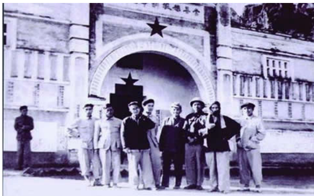
Hình G1. HCM bí mật sang Quảng Tây ngày 16.01.1950

Kẻ bán ÀI Nam Quan và bán luôn cả cơ đồ dân tộc Việt Nam cho Trung Cộng chính là Hồ Chí Minh và Phạm Văn Đồng. Máu bán nước ăn sâu vào từng đời của bọn lãnh đạo CSVN. Để chứng minh rõ ràng những tội lỗi của bọn bán nước buôn dân này vẫn còn những hình ảnh làm tang chứng.