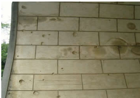
Dấu đạn giao tranh Trung-Việt trên khắp tường thành "Hữu Nghị Quan"

- Ngày 25.08.1978, khoảng trên 200 quân Việt Nam dùng vũ lực bắt buộc Hoa kiều phải hồi hương đi vào khu vực Hữu Nghị Quan. Lúc 17g30 cùng ngày, ngay trước cổng Hữu Nghị Quan, quân Việt Nam đánh chết 6 người, 82 người bị thương, 15 người chạy thoát. Công tác viên phía Trung Cộng lên tiếng cảnh cáo và xung đột đã xảy ra giữa hai bên cán bộ Trung-Việt. Ba ngày sau, quân Việt Nam tiếp tục tràn lên vùng biên giới tìm kiếm những Hoa kiều đang bỏ trốn... Chiến tranh biên giới Trung-Việt bắt đầu từ đây, cuộc chiến mà Trung Cộng lấy cớ "tự hào" là "Tự Vệ Phản Kích". Ái Nam Quan thêm một lần nữa chứng kiến xung đột Trung-Việt. Nhưng từ sau cuộc chiến này, Trung Cộng đã đẩy lui lãnh thổ Việt Nam ra khỏi Ái Nam Quan và bỗng xuất hiện cột mốc có tên gọi "Km0" thần thoại, nằm cách xa cổng Nam Quan hàng trăm thước.