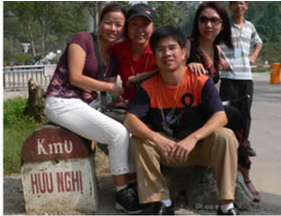
Chúng ngồi lên "Km0" của bọn Nam man! "Chúng ta là chủ nhân của lãnh thổ VN!"