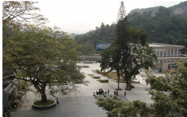
Cây si PVĐ nhìn từ trên lầu thành Hữu Nghị Quan. Cụm nhà trắng là Hải Quan TC xây lại trên nền "nhà tròn". Xa thẳm bên kia là cột Km0 hiện tại.