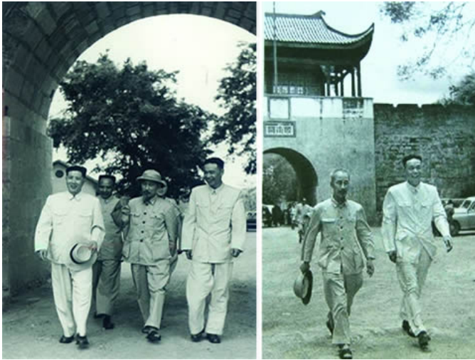
HCM bang giao với TC tại cổng Nam Quan trong những năm 1950

thỏa thuận theo Chánh Vụ Viện Trung Cộng, Việt Nam mở cửa tự do cho hai cửa khẩu Bình Nhi – Nam Quan. Năm 1953 đã có 276.000 lượt qua lại cổng Nam Quan giữa hai bên.