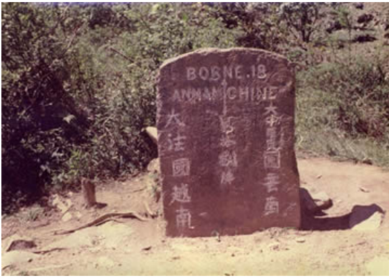
Phụ ảnh tham khảo "Cột Mốc Số 18" giả mạo (?)

Đây là "Cột Mốc Số 18" mà TC cho rằng đã đặt tại cổng Nam Quan. Khác với "Cột Mốc Số 18" theo Hiệp ước Pháp-Thanh (đã trình bày nơi chương I). Trên cột mốc này khắc rằng: "BORNE. 18 ANNAM-CHINE, Đệ Thập Bát Bài, Đại Pháp Quốc Việt Nam, Đại Trung Hoa Dân Quốc Vân Nam". Lịch sử nào ghi rằng Pháp thay mặt VN ký kết Hiệp ước Biên giới với chính quyền của Tưởng Giới Thạch? Loại cột mốc này là cùng kiểu với cột mốc số 53 tại khu vực Thác Bản Giốc. Những cột mốc thật sự của Hiệp ước Pháp-Thanh đã tiêu biến nơi đâu? Không ai biết rõ hơn biên giới Trung-Việt bằng Đảng CSVN, nhưng họ có nói gì không về hiện tượng này? Lặng câm! Ta nên nhớ, trong đề