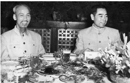
HCM và CÂL yến tiệc xa hoa tại Bắc Kinh tháng 06/1955