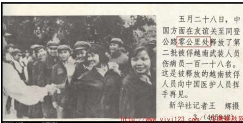
Trao trả tù binh

- Ngày 28.05.1980, Trung-Việt tiến hành trao trả tù binh tại "Km0" trên đường Đồng Đăng dẫn vào khu vực Hữu Nghị Quan