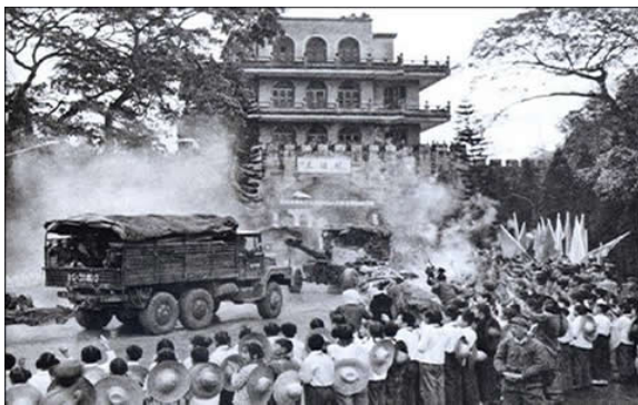
Trung Cộng ca khúc khải hoàn trở về cổng Hữu Nghị Quan sau chiến thắng