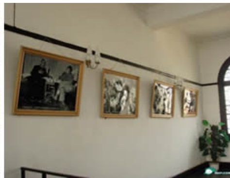
Lầu 2 tại Mục Nam Quan với nguyên trạng cuộc "hội đàm" giữa CẢL và HCM

- Ngày 09.04.1961, Chu Ân Lai và Hồ Chí Minh "hội đàm" tại lầu 2 của cổ thành Mục Nam Quan. "Hội đàm" về nội dung gì thì cả hai bên đều không công bố. Chỉ biết rằng cuộc "hội đàm" mờ ám tại Mục Nam Quan của hai lãnh đạo cộng