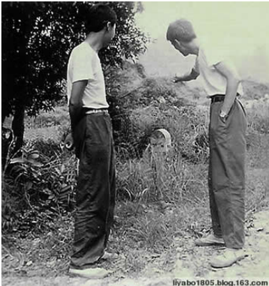
Năm 1979, hai tên Trung Cộng đang chỉ vào vị trí cột mốc "Km0".

Sự ra đời của "Km 0" cho đến nay vẫn rất khó hiểu. Theo "truyền thuyết", "Km 0" ra đời vào năm 1960 và Phạm Văn Đồng đã trồng cây si để đánh dấu vị trí. Có thực sự là PVĐ trồng cây si để đánh dấu vị trí biên giới Trung-Việt hay không? Hay chỉ đơn thuần là việc trồng cây kỷ niệm một sự kiện nào đó? (thói màu mè của CSVN). Năm 1958, chính tay PVĐ đã ký văn bản dâng biển cho Trung Cộng, bản đồ Bắc Việt thì Đảng CSVN dâng cho Trung Cộng vẽ, trong thời điểm lệ thuộc sự viện trợ của Trung Cộng thì làm sao nói chuyện căng thẳng biên giới, lãnh hải được. Còn cây si là cây si nào? Cây si thuộc loại cây nhiệt đới có sức tăng trưởng và phát tán rất nhanh. Không thể nào cho rằng cây si mà PVĐ trồng là cây si đứng sau cột "Km0". Hãy xem hình (so sánh với cây si trước cổng HNQ ở chương II).