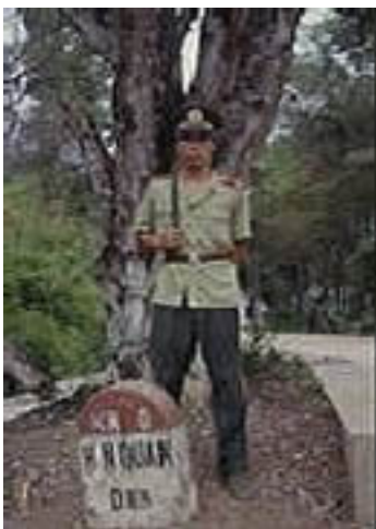
"Km0" trong những năm 1990. Biên phòng VN đứng gác nhưng quay mặt về phía VN.

Cỏ cây rậm rì, một gốc cây nhỏ phía sau (cây si từ năm 1960?). Phải chăng vị trí cột mốc chẳng phải bị di dời đi hàng trăm thước nào cả. Nó đã nằm đó từ những năm 1960, như một thỏa thuận "hữu nghị" khi HCM dành trọn Ải Nam Quan để tiếp nhận vũ khí của TC gây máu lửa trên miền Nam Việt.