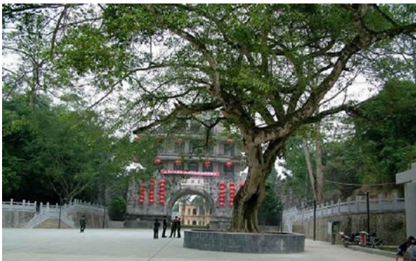
Cây si do PVD trồng (?)

Cây si do PVD trồng (?) nhìn từ bên phía VN. Vị trí tương ứng với khoảng cách của tường thành cổng Nam Quan cũ bên VN)