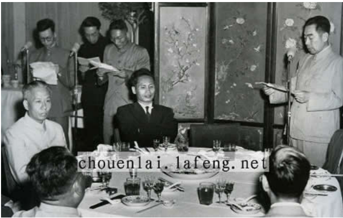
Phạm Văn Đồng ra mắt Chu Ân Lai