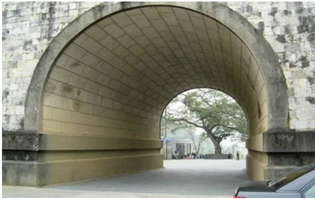
Cây si PVĐ nhìn từ bên cổng Hữu Nghị Quan của TC