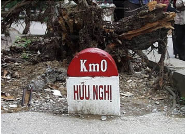
"Km0" mất chữ Quan

"Cây si PVĐ" bị đốn bỏ dã man vào năm 2005. Cột mốc cũng chỉ còn chữ "Hữu Nghị". Đảng CSVN không dám nhận thêm chữ "Quan". Xóa bỏ vĩnh viễn lịch sử để làm vừa lòng đàn anh TC!