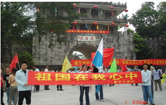
Những hoạt động của Trung Cộng tại Ải Nam Quan ngày càng rầm rộ, hoành tráng. Từng đợt học sinh trên các miền được đưa về Hữu Nghị Quan để nghe giáo dục về lòng yêu nước! "Tổ Quốc Tại Ngã Tâm Trung" (Tổ quốc trong tim ta)