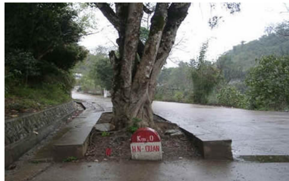
"Km0" trong những năm đầu 2000, khi đang xây dựng lại cảnh quan "Hữu Nghị" và kế hoạch cao tốc Nam-Hữu. Lúc này trên cột còn ghi "Hữu Nghị Quan" và "cây si PVĐ" còn đó