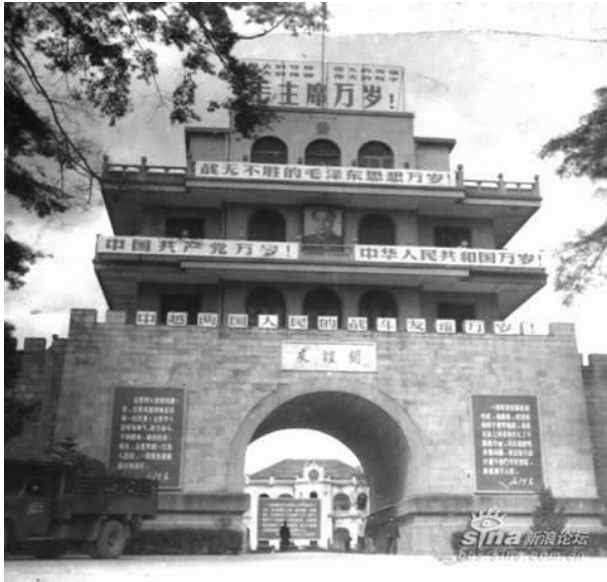
Hữu Nghị Quan năm 1965. Biểu ngữ của TC và hình Mao Trạch Đông phoi vào phần lãnh thổ VN

- Ngày 25.08.1978, khoảng trên 200 quân Việt Nam dùng vũ lực bắt buộc Hoa kiều phải hồi hương đi vào khu vực Hữu Nghị Quan. Lúc 17g30 cùng ngày, ngay trước cổng Hữu Nghị Quan, quân Việt Nam đánh chết 6 người, 82 người bị thương, 15 người chạy thoát. Công tác viên phía Trung Cộng lên tiếng cảnh cáo và xung đột đã xảy ra giữa hai bên cán bộ Trung-Việt. Ba ngày sau, quân Việt Nam tiếp tục tràn lên vùng biên giới tìm kiếm những Hoa kiều đang bỏ trốn... Chiến tranh biên giới Trung-Việt bắt đầu từ đây, cuộc chiến mà Trung Cộng lấy cớ "tự hào" là "Tự Vệ Phản Kích". Ái Nam Quan thêm một lần nữa chứng kiến xung đột Trung-Việt. Nhưng từ sau cuộc chiến này, Trung Cộng đã đẩy lui lãnh thổ Việt Nam ra khỏi Ái Nam Quan và bỗng xuất hiện cột mốc có tên gọi "Km0" thần thoại, nằm cách xa cổng Nam Quan hàng trăm thước.