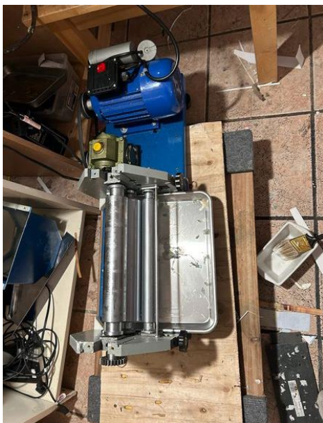
Một góc nhà in.

Ham chi cái máy dán keo Ham chi làm đẹp hardcover bìa ngoài Lên Ebay, 500 đồng Order từ tận bên Tàu xa xăm Ba năm rồi, máy nằm im Keo thì phết, nhưng bìa thì thảm thê Thôi đành ta phải return Nhưng ai cũng hoảng khi đóng thùng gửi đi Nặng hơn một cái đầu xe Còn ta thì một lão già liêu xiêu Thôi thì bỏ đó ba năm Để rút kinh nghiệm mà chừa lần sau Không ngờ ta có cái đầu Chỉ 15 phút là khỏi cần máy glue Thấy mình vui quá là vui Hỏi ông Steinbeck "Cửa chuột và người " ai hơn.