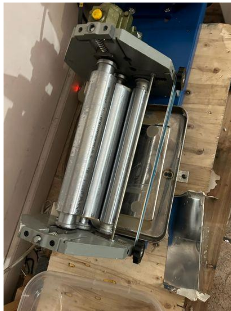
Máy dán keo khi mua