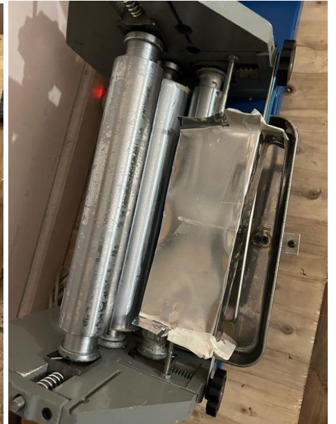
Máy dán keo đã được chế lại.