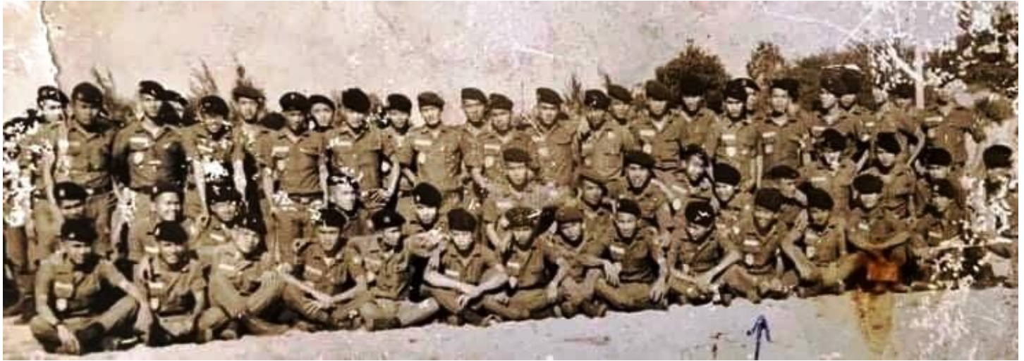
Hình Đại đội 33 SVSQCSQG năm 1973 -1974